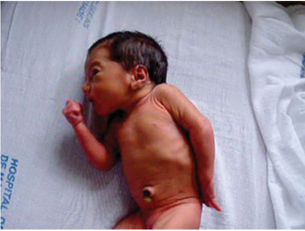
Fig. 2 Paralisia obstétrica de Erb.

lesão de todas as raízes do plexo; e a paralisia baixa ou de Klumpke (C8-T1), na qual os músculos do antebraço e mão são os mais acometidos. A gravidade da lesão depende das raízes afetadas e de sua extensão.