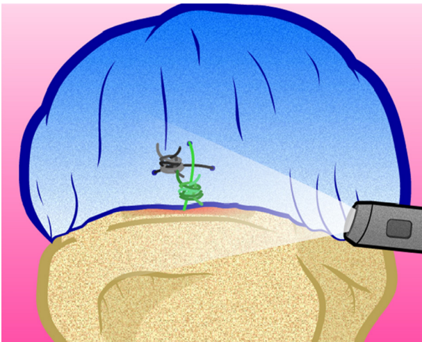
Figura 4 – Vista final do ponto Mason-Allen.

Retirada a tipoia, iniciou-se programa de reabilitação, com analgesia, hidroterapia, reabilitação de amplitudes de movimentos (ADM) passivos e autopermissivos, e iniciou-se