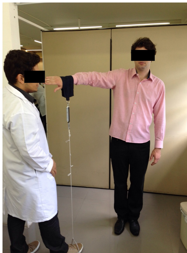
Figura 1 – Método de posicionamento e medida de força com o uso de uma balança doméstica, segundo a posição do teste de Jobe.

Foram inseridas entre duas a três âncoras metálicas rosqueadas com 4 mm de diâmetro de acordo com a extensão da desinserção labial, portando fios não absorvíveis número 2, com os quais se fez a reconstrução capsulolabial com retensionamento do complexo labioligamentar anteroinferior (efeito capsular shift) (fig. 2). 18