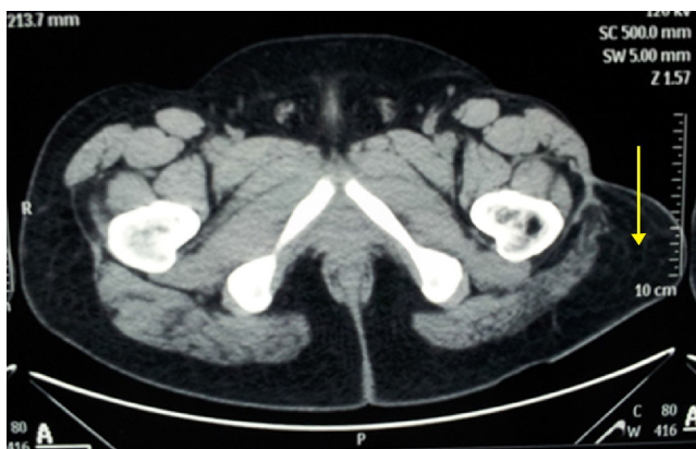
Figura 2 – Corte tomográfico axial que evidencia grande coleção líquida (seta), entre o subcutâneo e a fáscia muscular.

Essas lesões envolvem a aplicação de forças súbitas e de alta intensidade, a partir da compressão, estiramento, torção ou fricção das estruturas. 7,9,12 O resultado é a separação do tecido subcutâneo da fáscia muscular, que lesiona os vasos perfurantes. 1,5,15 O líquido hemolinfático é cercado por tecido granuloso, que pode levar à formação de uma