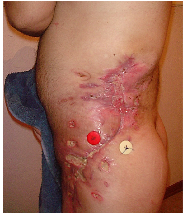
Figura 7 – Imagem final após a realização dos enxertos.

Neste estudo, apesar de o diagnóstico ter sido invariavelmente feito na fase aguda, pelo exame físico minucioso e por exames de imagem, optou-se pelo desbridamento tardio