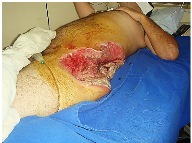
Figura 5 – Imagem de flanco e quadril, em processo de cicatrização secundária (tecido de granulação).