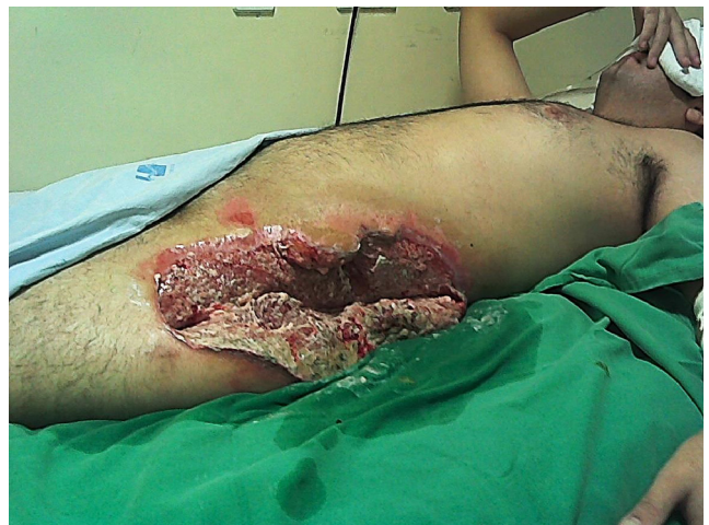
Figura 4 – Imagem de flanco e quadril, em processo de cicatrização secundária (tecido de granulação).