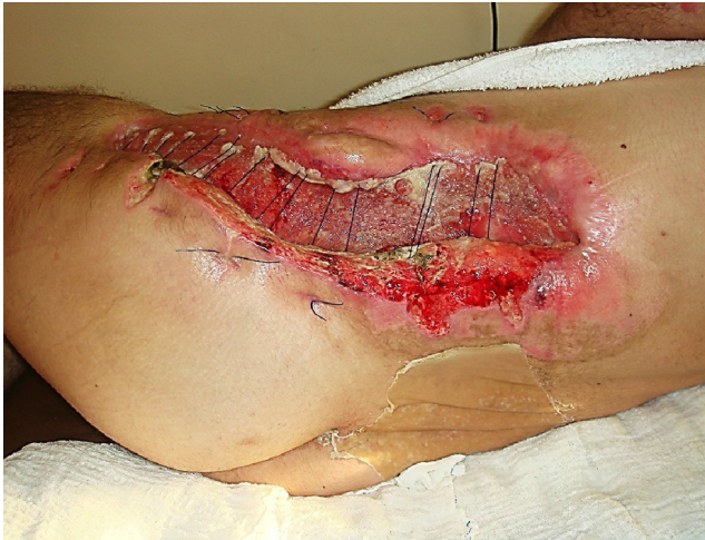
Figura 6 – Tentativa de aproximação das bordas da ferida, previamente à feitura dos retalhos miocutâneos.

pseudocápsula fibrosa, prevenir a reabsorção dos fluidos e predispor à colonização bacteriana e à infecção. 9,11-14