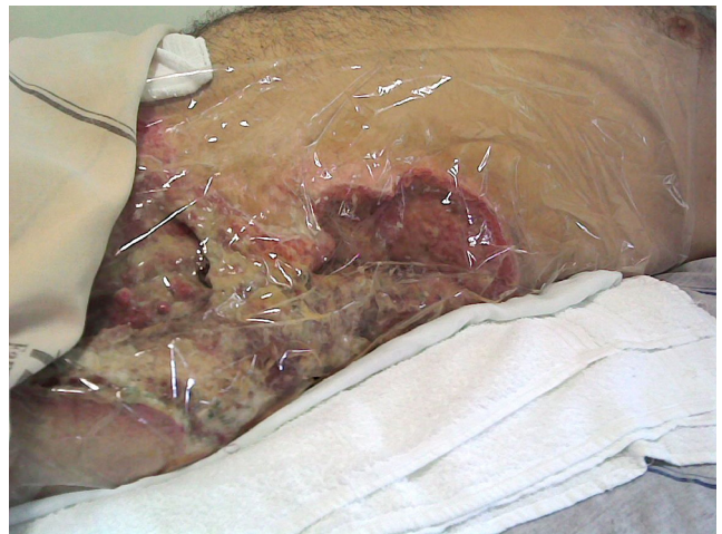
Figura 3 – Imagem de flanco e quadril, após desbridamento inicial, que evidencia necrose e infecção.