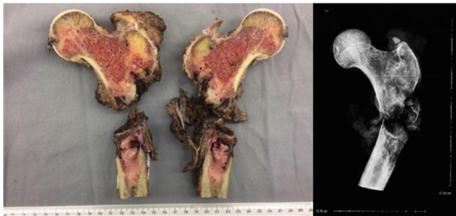
Figura 2 – Peça cirúrgica evidencia a metástase óssea localizada no fêmur proximal, com fratura em osso patológico, e sua respectiva imagem radiográfica.