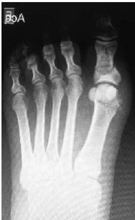
Fig. 3 Procedimento de Reverdin-Isham (RI) associada à exostectomia, tenotomia e osteotomia de Akin.

O curativo é realizado com gaze e fita adesiva, mantendo o dedo em posição neutra, com 10° de flexão. O curativo foi trocado semanalmente, durante 4 semanas, e o suporte imediato de peso com sapatos rígidos foi permitido como tolerado. Quando a patologia era bilateral, os pacientes foram operados em ambos os pés. A medição angular foi feita, e os questionários, aplicados, em seis semanas, seis meses e um ano.