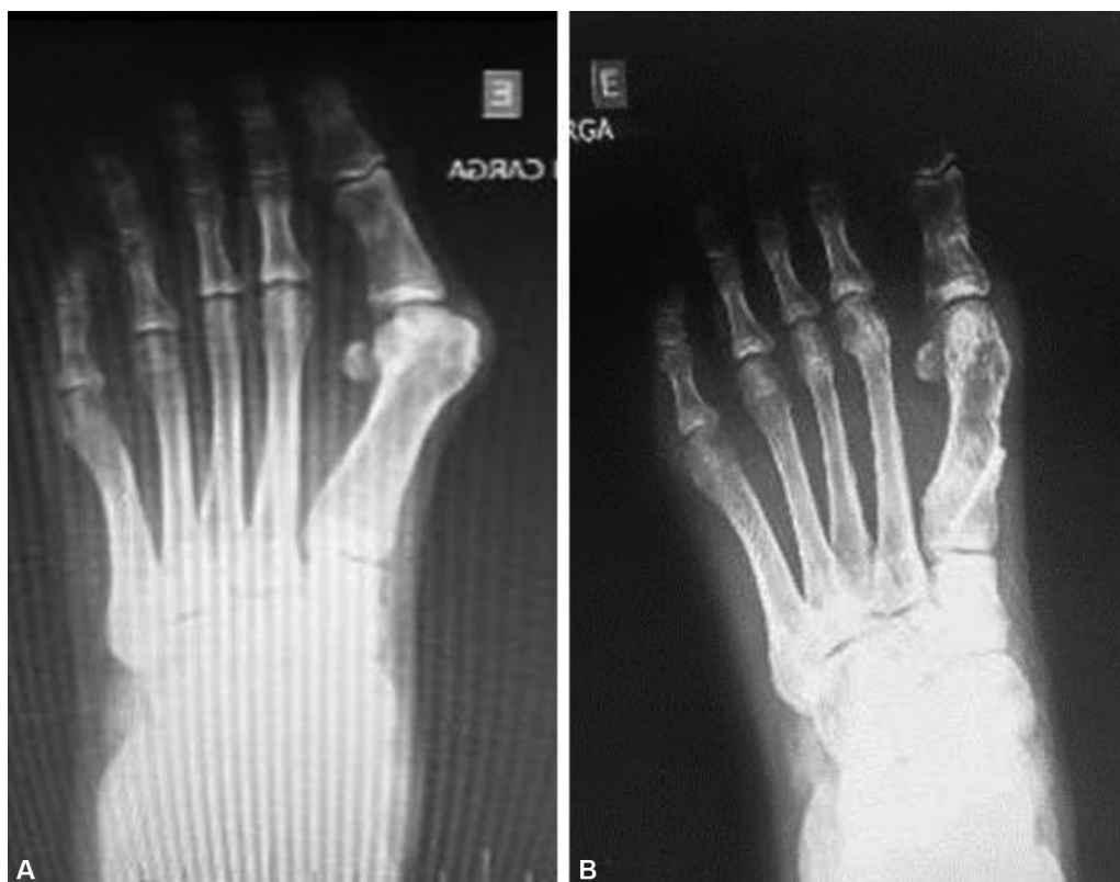
Fig. 9 (A) Pré-operatório de caso grave de hálux valgo; (B) pós-operatório de osteotomia similar ao procedimento de Ludloff.