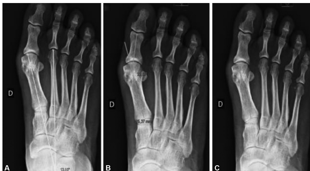
Fig. 1 Medidas angulares. (A) Ângulo de hálux valgo (AHV); (B) ângulo intermetatarsal (AIM); (C) Ângulo articular distal do metatarso (AADM).

Uma incisão foi feita na base plantar da exostose do primeiro metatarso com o bisturi Beaver 64 (BVI, Waltham, MA, EUA). Depois, removemos o periósteo com o raspador ou o bisturi, e realizamos uma exostectomia usando a broca wedge de 3.1 mm. O osso foi removido da articulação por compressão manual ou curetagem, e às vezes com soro fisiológico. Em seguida, fizemos uma incisão dorsolateral na articulação metatarsofalangeal do hálux para realizar a tenotomia do tendão do adutor de hálux e capsulotomia lateral (→Fig. 2A e B). Para isso, movemos o dedo medialmente, promovendo um varo do hálux, introduzindo o bisturi Beaver com a A apontada lateralmente e