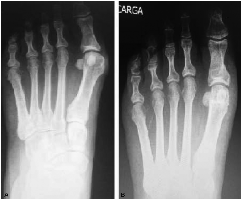
Fig. 7 (A) caso moderado no pré-operatório com AADM alterado; (B) procedimento de RI pós-operatória com exostectomia + tenotomia + procedimento de Akin.