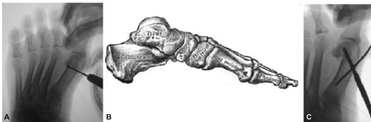
Fig. 4 (A) Controle de fluoroscopia mostrando a posição da broca, paralela à superfície articular do primeiro metatarso durante o primeiro corte para a osteotomia em chevron; (B) a linha vermelha mostra as direções para o corte em chevron; (C) fixação do chevron percutâneo com um parafuso. O fio de Kirschner é usado para ajudar na redução.