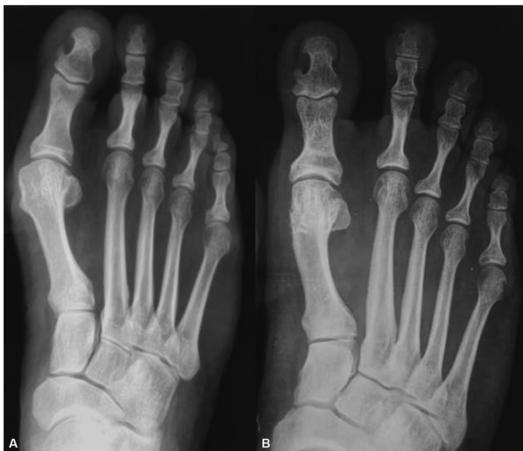
Fig. 6 (A) caso leve no pré-operatório. (B) caso leve no pós-operatório (exostectomia + liberação de tecido mole distal + procedimento de Akin).

Em casos graves, em que a OPPF foi executada (→ Fig. 9A e B ), a média pré-operatória do AHV diminuiu de 39,2° (gama: 30° a 51°) para 17,7° (gama: 8° a 28°), com correção média de 21,5°. A média do AIM no pré-operatório diminuiu de 18,4° (gama: 15° a 23°) para 11,8° (gama: 7° a 17°), com uma correção média de 6,8°. A média do score da AOFAS no pré-operatório foi de 41,8 (gama: 34 a 50) e aumentou para 88 (gama: 70 a 100) pontos no último seguimento. Um paciente ficou insatisfeito com o desfecho devido a recidiva.