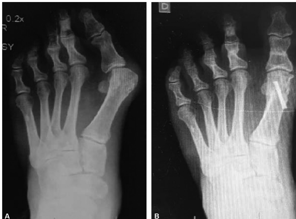
Fig. 8 (A) Pré-operatório de caso moderado com incongruência articular; (B) pós-operatório depois de chevron percutâneo.