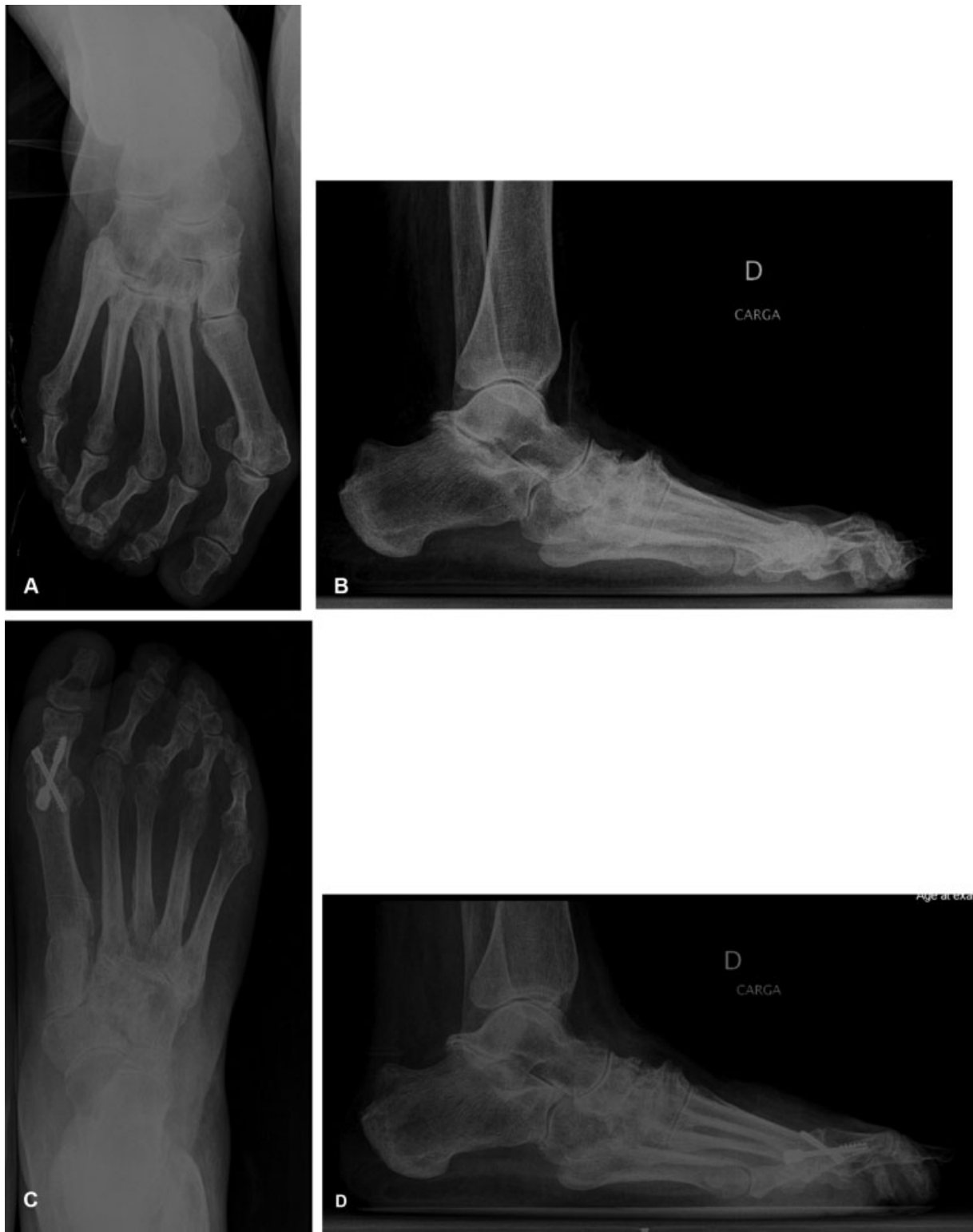
Fig. 4 Imagens radiográficas pré- e pós-operatórias de uma mulher de 58 anos de idade com hallux rigidus submetida à artroplastia de 1MTP. (A) Radiografia pré-operatória em incidência anteroposterior com a paciente em pé; (B) Radiografia pré-operatória em incidência em perfil com a paciente em pé; (C) Radiografia pós-operatória em incidência anteroposterior com a paciente em pé, 3 anos após a cirurgia; (D) Radiografia pós-operatória em incidência em perfil com a paciente em pé, 3 anos após a cirurgia.