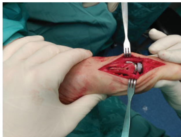
Fig. 1 Fotografia intraoperatória da artroplastia de 1MTP mostrando o encaixe correto dos implantes.

A mesma prótese (Metis, Newdeal SA; Integra Lifesciences ILS, Plainsboro Township, NJ, EUA) foi utilizada na artroplastia de 1MTP. Trata-se de uma prótese modular de titânio, não restritiva, com três componentes, não cimentada e revestida por hidroxapatita. Uma incisão medial do meio da falange ao meio do metatarso foi realizada para expor a primeira articulação metatarsofalângica. No preparo das superfícies articulares, osteófitos e cartilagens foram removidos e uma bunionectomia (quando necessária) foi realizada. Após a determinação do tamanho do componente metatarsico, o metatarso foi seccionado com a guia de corte e o implante foi testado. É importante destacar que a secção do metatarso foi realizada em todos os pacientes com index plus (primeiro metatarso mais longo do que o segundo metatarso) para que os dois ossos apresentassem o mesmo comprimento ( index plus minus ). A falange foi, então, preparada com mandril e o implante de tamanho apropriado foi escolhido e testado. A amplitude de movimento e a frouxidão