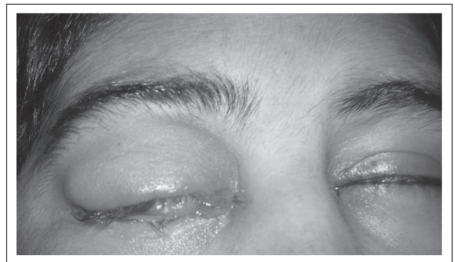
Figure 1. Edema and hyperemia with right ocular proptosis.

trophil cytoplasmic antibody with titer 1/20 in cytoplasmic pattern (C-ANCA). The ophthalmologic evaluation suggested a possibility of Behçet's Disease, due to a possible hipopion not confirmed in our service, which in its reevaluation found cotton-wool exudates and perivascular hemorrhages, being suggested the possibility of retinitis by CMV. The puncture of the ocular anterior chamber and vitreous didn't identify bacterial and/or fungic infection. Because of the strong possibility of CMV retinitis we initiated ganciclovir, parenteral and ocular antibioticotherapy. The ocular ultrasonography (US) evidenced partial displacement of the retina and choroid, with inflammatory and hemorrhagic process. The orbit tomography showed the right ocular globe with increased dimensions, proptosis and inflammatory process. Laboratory tests showed blood