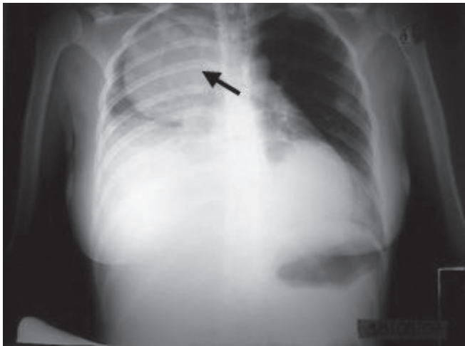
Figura 1 – Radiografia de Tórax de Metástase Pulmonar

radiografia de tórax que evidenciou opacidade extensa, de etiologia não definida no campo superior direito (Figura 1).