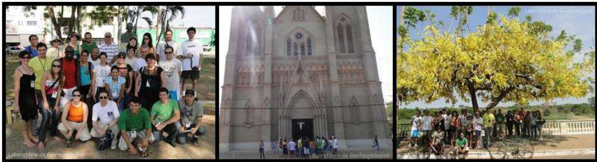
Figura 6 - Execução do segundo pré-teste em diferentes lugares

Os congressistas interessados deveriam adquiri-lo junto à secretaria do evento. Vinte e quatro (24) participantes de diversos estados do Brasil (São Paulo, Bahia, Mato Grosso do Sul, Rio de Janeiro, etc.), optaram por realizá-lo (Figura 6).