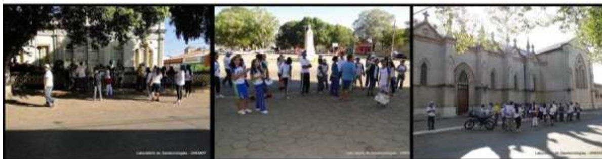
Figura 8 - Visitação no Centro Histórico realizada com os alunos do 7º ano da SESIESCOLA Leonor Barreto Franco

Em junho de 2011 junto aos alunos do 7º ano da SESIESCOLA Leonor Barreto Franco, vindos de Cuiabá (figura 8).