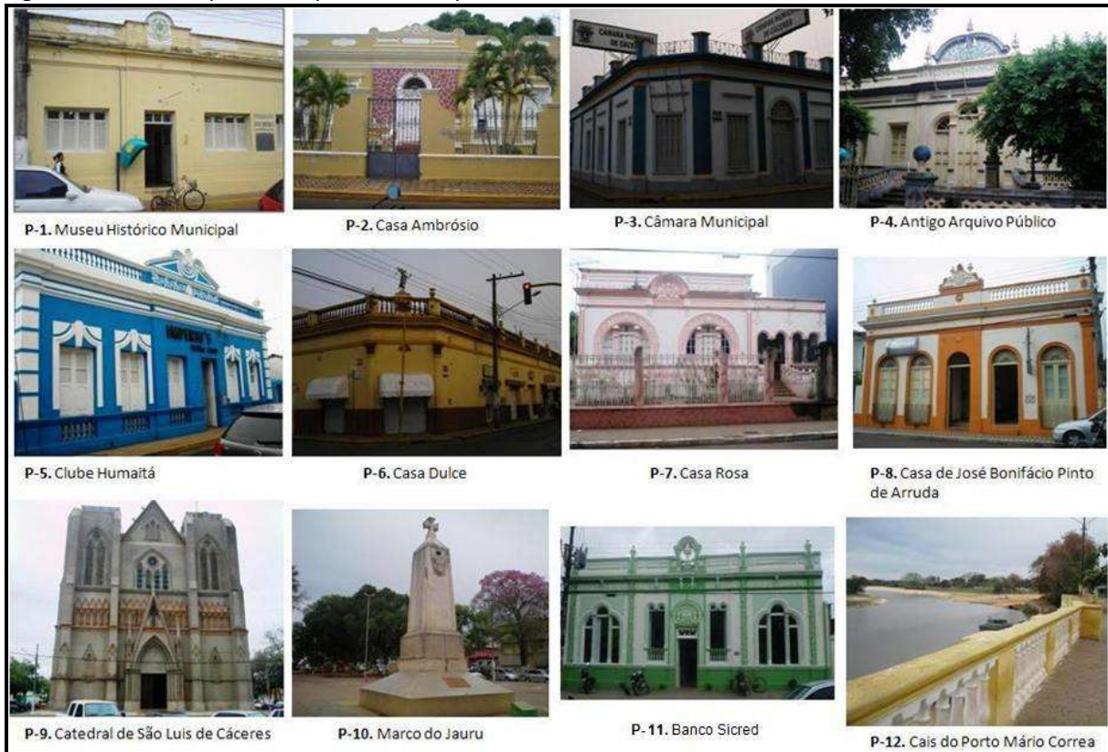
Figura 2 - Pontos de parada do percurso interpretativo