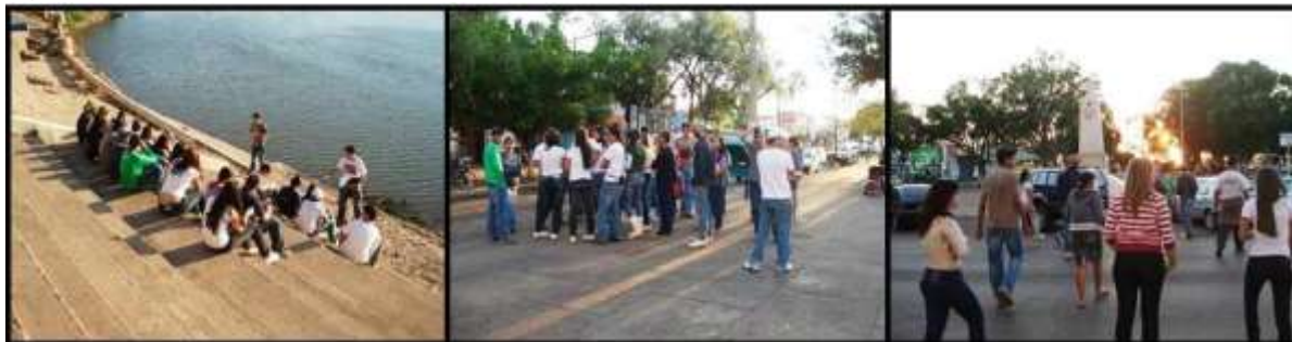
Figura 7 - Visitação no Centro Histórico realizada com os alunos do 7º e 8º da Escola Estadual 14 de Fevereiro