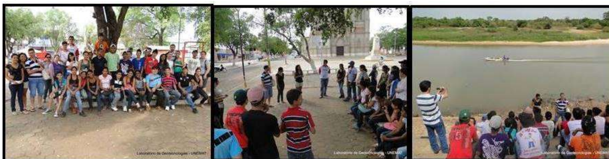
Figura 9 - Visitação no Centro Histórico realizada com os alunos do 8º e 9º da escola Estadual Irene Ortega

Em setembro de 2011 a proposta do percurso interpretativo, devidamente formatada para fins de educação patrimonial foi executada junto aos alunos do 8º e 9º da escola Estadual Irene Ortega, advindos de Mirassol D’Oeste (figura 9). Estas atividades foram viabilizadas por convênios firmados junto as Escolas e institucionalizados na Universidade.