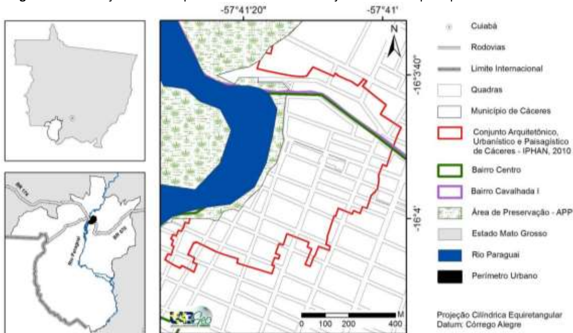
Figura 1 - Localização do município de Cáceres e do seu conjunto tombado pelo Iphan