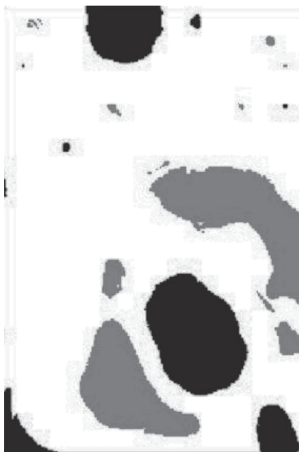
Figura 1 - Mapa dos resíduos de regressão do pastejo dado pela equação 3: as áreas em preto caracterizam áreas em que o pastejo pode ter sido subestimado, as áreas em cinza aquelas em que pode ter sido superestimado e em branco são as áreas em que o pastejo foi bem representado pelo modelo de regressão.

Uma estratégia interessante para o melhor entendimento do papel dessas variáveis na definição do pastejo é proceder à análise de resíduos da regressão pelo SIG (Eastman, 1997); com ela é possível gerar mapas de resíduos, que caracterizam, dentro do piquete, as áreas onde a equação de regressão gera valores superestimados (valores negativos), subestimados (valores positivos) ou valores reais de pastejo, como apresentado na Figura 1, sendo que as áreas em vermelho caracterizam que o pastejo foi subestimado e as áreas em azul superestimado, as áreas em preto representam aquelas em que o pastejo foi bem representado pelo modelo de regressão apresentado na equação 3.