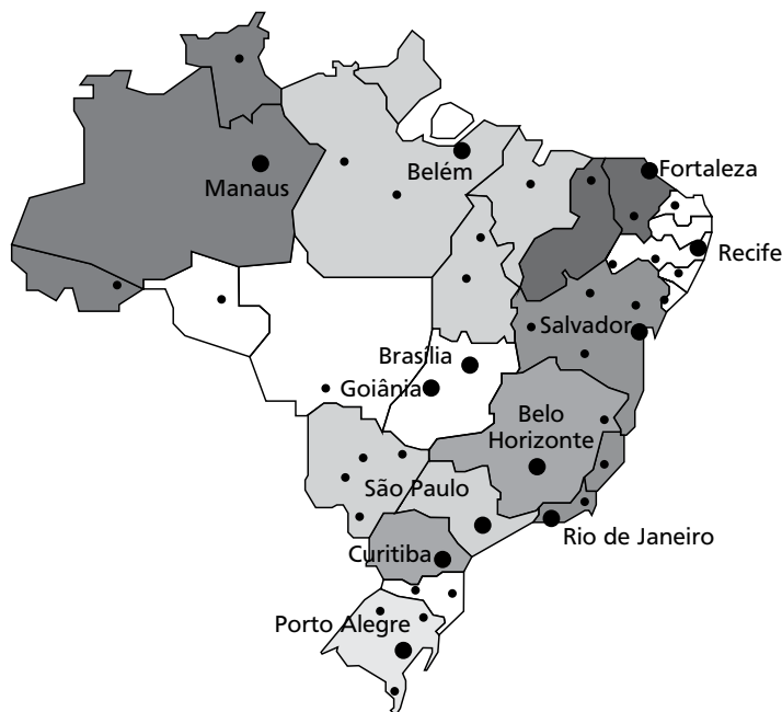
Figura 1 – Macropolos brasileiros e suas áreas de influência

A Figura 1 apresenta a distribuição da regionalização de Lemos et al. (2003) no mapa do Brasil, no qual é possível visualizar as áreas de influência de cada macropolo: