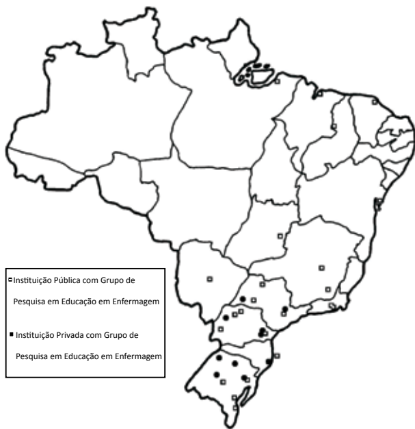
Figura 1 - Instituições de Ensino Superior (Públicas e Privadas) que possuem Grupos de Pesquisa de Educação em Enfermagem no Brasil - CNPq/Brasil, 2005-2006

Considerando-se o total de IES com Cursos de Graduação em Enfermagem no Brasil em 2006, nota-se que 28,7% das IES Pública apresentam Grupos de Pesquisa de Educação em Enfermagem, contra apenas 2,6% das IES Privadas. Em relação ao ano de criação dos GPEE, dois se constituíram na década de 80, 15 se estruturaram na década de 90 do século XX e 30 a partir do ano 2000.