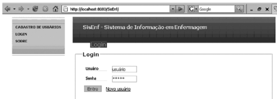
Figura 1 - Tela de abertura do SisEnf

enfermeiro entrará com seu login e senha individual, previamente cadastrados no sistema, a fim de se responsabilizar por seus registros. Neste caso, todas as assinaturas serão preenchidas automaticamente.