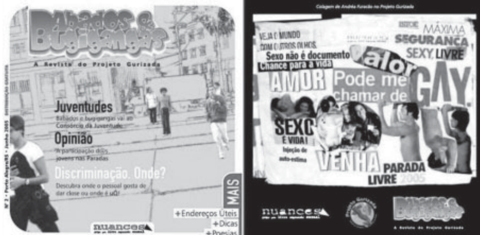
Edição 2 – capa e contracapa