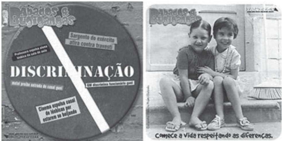
Edição 1 – capa e capa (dois lados – duas capas em uma revista)

A produção da revista Babados & Bugigangas surgiu como uma estratégia de intervenção na ocupação da cidade, assumindo uma estética afinada ao design contemporâneo e recusando, assim, a “estética simplória” geralmente presente nas produções no campo da AIDS. A sua estética alinha-se ao público que acessa o projeto e que a produz, o qual é plástico, colorido, diverso e divertido.