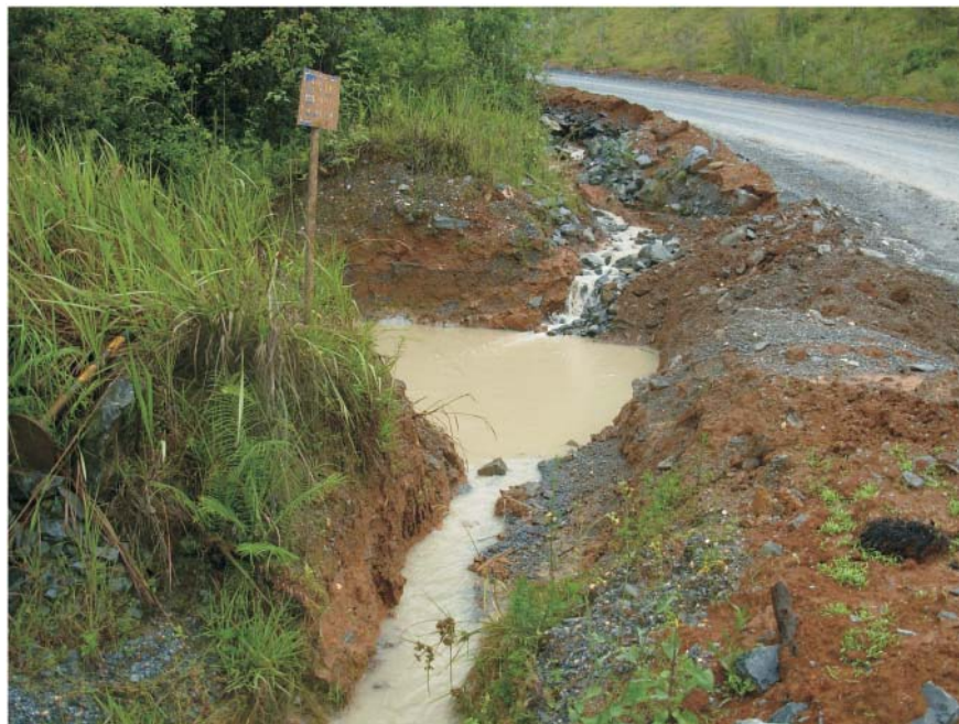
Figura 2 - Sistema de drenagem composto por canaletas e bacias de decantação escavadas ao longo das vias de acesso, para retenção de sedimentos provenientes dos pátios de estocagem, áreas de apoio e vias de acesso (mina 9).

pilhas, que o sistema de drenagem não havia sido dimensionado com base em estudo hidrometeorológico. Além dessa deficiência, notou-se que, em uma das