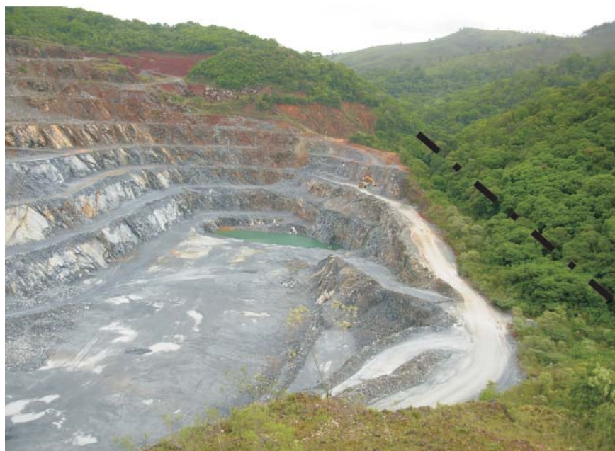
Figura 5 - Área de vegetação ciliar em vias de recuperação situada às margens de um córrego (indicado em preto) e previamente usada como pátio auxiliar da mina 9. Notar, à direita da foto, fragmento florestal integrante da reserva legal da propriedade.