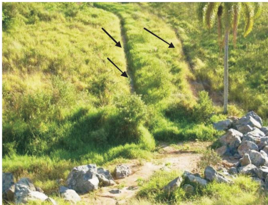
Figura 4 - Parte do sistema de drenagem da pilha de estéril da mina 2, observando-se canaletas revestidas de concreto e bacia de decantação com enrocamento para reduzir a velocidade do escoamento superficial.

O estudo, também, constatou que as minas submetidas ao licenciamento ambiental, por meio da preparação de um detalhado estudo de impacto ambiental, apresentam as melhores práticas de planejamento e boa conformidade para práticas de gestão, o que sugere que o licenciamento ambiental tem influência positiva sobre a RAD. De modo geral, as empresas estão aplicando práticas parcialmente eficazes para o estabelecimento de condições favoráveis para o sucesso das iniciativas de RAD.