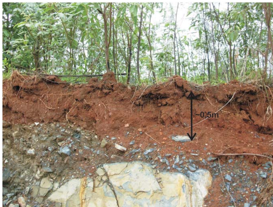
Figura 3 - Corte realizado em área recuperada para abertura de acesso, mostrando-se uma camada de argila colocada para recobrir estéréis e facilitar o crescimento da vegetação nativa. Com o desenvolvimento da vegetação, nota-se o enraizamento das plantas, o que melhora paulatinamente a qualidade do solo (mina 9).