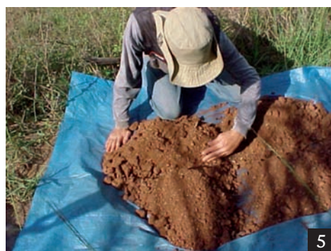
Figura 4 Abertura de canal de amostragem em antiga frente de extração, em propriedade de oleiro associado à ASCER.