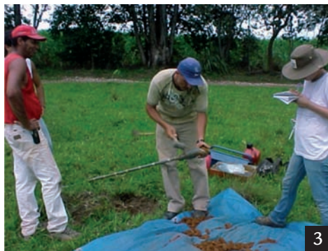
Figura 2 Retirada do material argiloso do furo de sondagem, sendo utilizado trado com extremidade no formato de caneco.