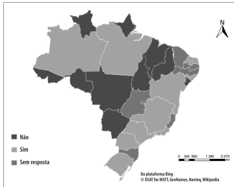
Figura 1 – Distribuição de assessorias de comunicação nos Conselhos das Secretarias Municipais de Saúde, por Unidade da Federação, Brasil, 2014-2015

A média de tempo de trabalho na instituição foi de 2,4 anos (DP=1,65), com uma variação de 1 ano para o menor e 5 anos para o maior. A média de tempo de serviço em comunicação na área da saúde foi de 4,3 anos (DP=2,8).