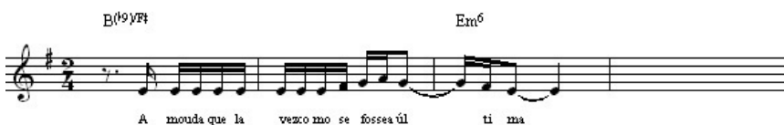
Figura 4: Primeiro verso de “Construção”. 27

O ritmo e acentuação da melodia ao longo das duas composições são idênticos, à diferença da última célula rítmica dos versos, que, em