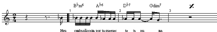
Figura 3: Primeiro verso de “Roendo as Unhas”.

Nessa chave, não há como se negar a similaridade entre “Roendo as unhas” e “Construção”, 26 de Chico Buarque, especialmente no que se refere à métrica dos versos, em sua maioria dodecassílabos e com acentuação idêntica. A aproximação segue no ritmo da melodia, porém com um elemento que muda o caráter das duas composições. Abaixo (Figuras 3 e 4), uma comparação entre o primeiro verso das duas canções: