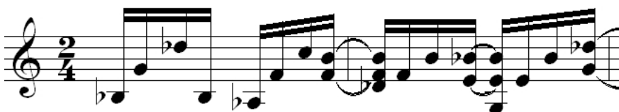
Figura 1: Levada de violão de “Roendo as unhas”.

A instrumentação tocada em “Roendo as unhas” é violão, piano, trombone, flauta, baixo elétrico e percussão. O primeiro elemento da música que já destoa e caminha na contramão da maioria das composições do sambista é a base harmônica tocada ao violão (Figura 1).