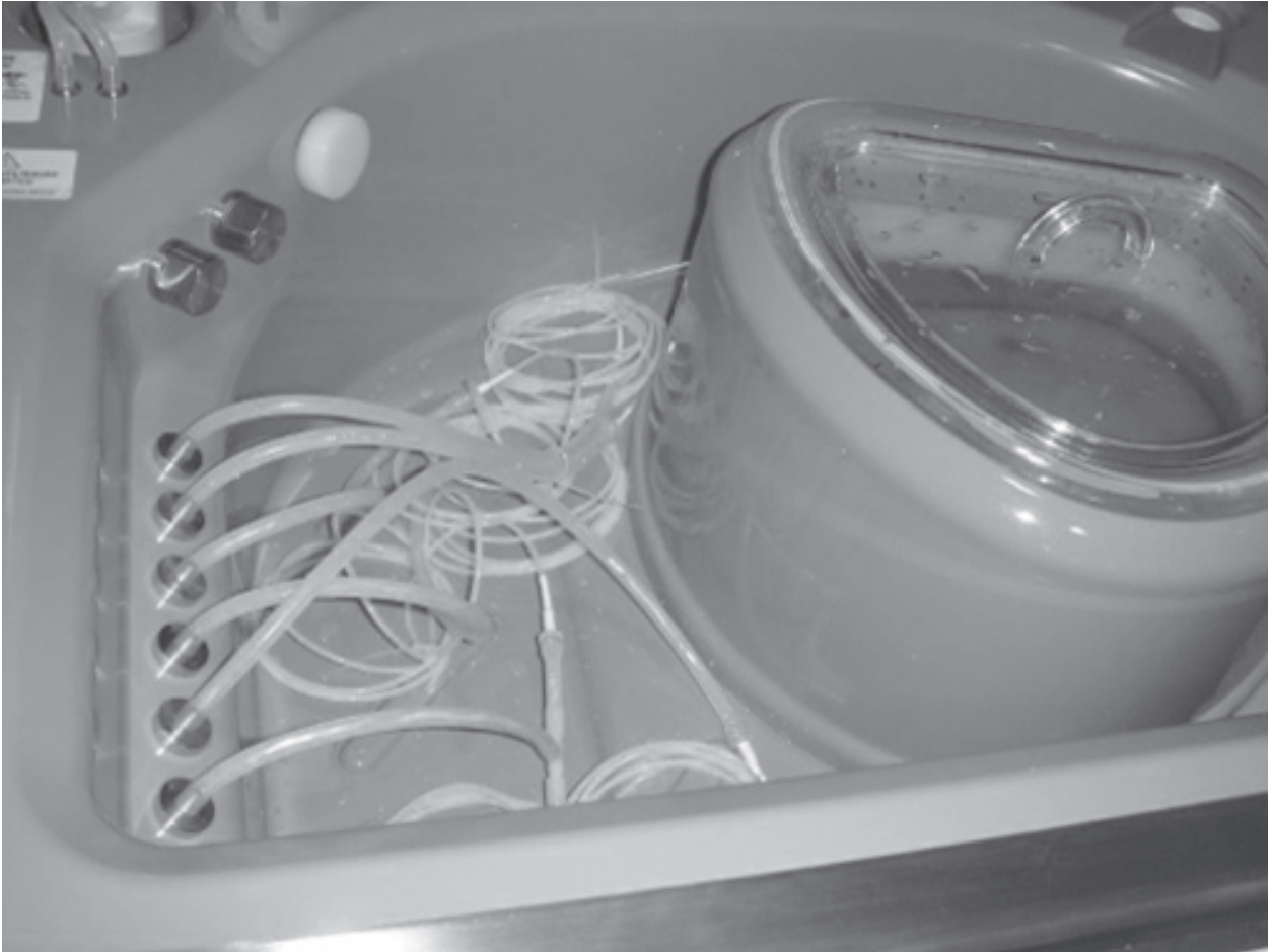
Figura 1 – Especímenes de prueba fijados dentro de los conectores del reprocesador automatizado del endoscopio examinado.

El método propuesto se aplicó a un dispositivo hecho en Brasil y que fue indicado para el reprocesamiento automatizado de las primeras marcas de endoscopios flexibles disponibles localmente. El reprocesador se utiliza para la desinfección de alto nivel y permite la programación de los siguientes pasos: prueba de fugas, lavado de detergente (con o sin enzimas) y el enjuague, desinfección de alto nivel y el enjuague, y el secado de los canales del endoscopio.