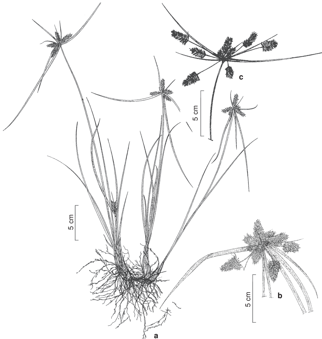
Figura 1 – Cyperus aggregatus (Willd.) Endl. – a. hábito, antelódio com espigas subsésseis; b. antelódio com espigas pedunculadas; c. antelódio com espigas pedunculadas e subsésseis (a Hefler & Longhi-Wagner 373; b Hefler 495; c Hefler & Longhi-Wagner 405).

Figure 1 – Cyperus aggregatus (Willd.) Endl. – a. habit, anthela with subsessile spikes; b. anthela with peduncle spikes; c. anthela with peduncle and subsessile spikes (a Hefler & Longhi-Wagner 373; b Hefler 495; c Hefler & Longhi-Wagner 405).