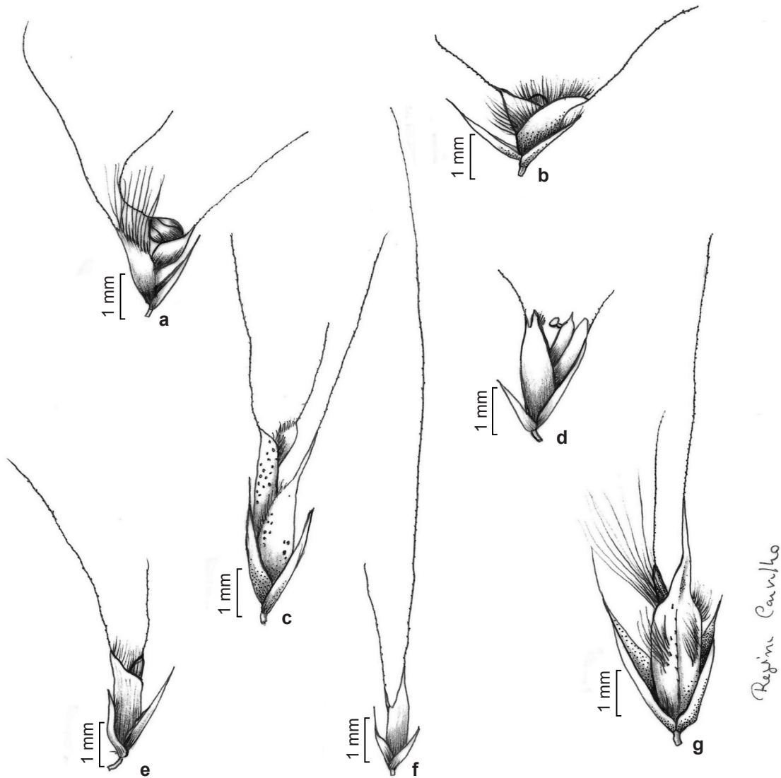
Figura 2 – a-g. espiguetas das espécies de Chloris ocorrentes em Pernambuco. a. C. barbata (D. Andrade-Lima & J. Medeiros-Costa 192); b. C. elata (B. Pickel 768); c. C. exilis (D. Andrade-Lima 9319); d. C. gayana (E. Tenório 1089); e. C. orthonoton (B. Pickel 692); f. C. pycnothrix (E. Tenório 1042); g. C. virgata (A. Sarmiento 377a).

Figure 2 – a-g. spikelets of the Chloris species occurring in Pernambuco. a. C. barbata (D. Andrade-Lima & J. Medeiros-Costa 192); b. C. elata (B. Pickel 768); c. C. exilis (D. Andrade-Lima 9319); d. C. gayana (E. Tenório 1089); e. C. orthonoton (B. Pickel 692); f. C. pycnothrix (E. Tenório 1042); g. C. virgata (A. Sarmiento 377a).