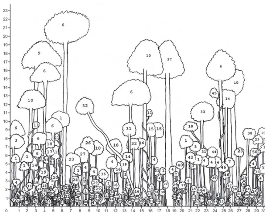
Figura 2 – Diagrama de Perfil de um trecho de 10 × 30 m de Floresta Estacional Semidecidual Submontana no Parque Nacional da Chapada Diamantina, Lençóis, Bahia, com indivíduos numerados conforme espécies listadas na Tabela 2. Figure 2 – Profile diagram of an area of 10 × 30 m Submontane Semideciduous Seasonal Forest in the Chapada Diamantina National Park, Lençóis, Bahia, Brazil, with individuals numbered as listed species in Table 2.

As famílias com maior riqueza de espécies foram Fabaceae com 13 espécies (11,9%), Myrtaceae e Lauraceae com 10 espécies cada (8,6%), Apocynaceae com sete espécies (6%),