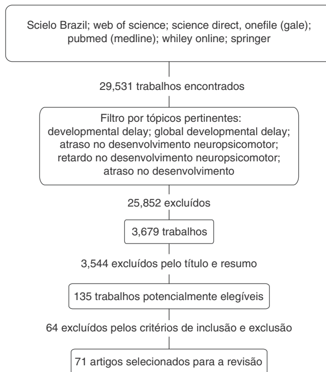
Figura 1 Etapas da busca bibliográfica.

Com o objetivo de resgatar a origem do termo, a estratégia de busca não teve limite de data, incluindo desde os primeiros registros sobre o tema, publicados em 1940, até janeiro de 2013, resultando em 29.531 documentos. Visando focar em termos mais específicos, em cada base foi utilizado o recurso filtrar meus resultados , por tópicos. Por meio de filtro, foi observado que, das palavras-chave utilizadas, os termos developmental delay e global developmental delay para a literatura internacional e atraso do desenvolvimento , atraso do DNPM e retardo do DNPM nos bancos de dados nacionais foram os mais adequados para englobar e encontrar o maior número de artigos relacionados ao objetivo proposto. Assim, após utilização do filtro para estes termos, foram selecionados 3.679 estudos. Posteriormente, os títulos e os resumos dos trabalhos localizados foram analisados, para eliminar aqueles não relacionados ao tema proposto. Para selecionar os estudos para a leitura na íntegra, como ilustrado na figura 1 , foram aplicados os seguintes critérios de inclusão e exclusão até se chegar aos trabalhos finais: