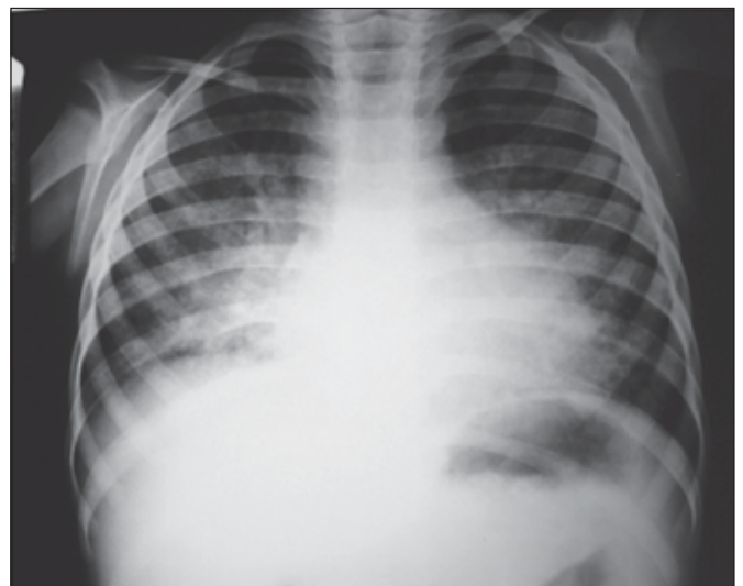
Figura 3 – Redução significativa da área cardíaca. Infiltrado reticulonodular bilateral predominante em bases pulmonares.