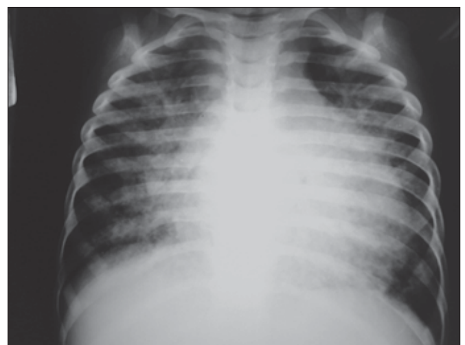
Figura 1 – Evidente cardiomegalia e sinais de congestão circulatória pulmonar.