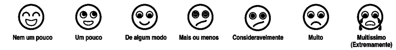
Figura 2. Escala de apoio visual adaptada à Escala de respostas do SADL, para questões com pontuação invertida