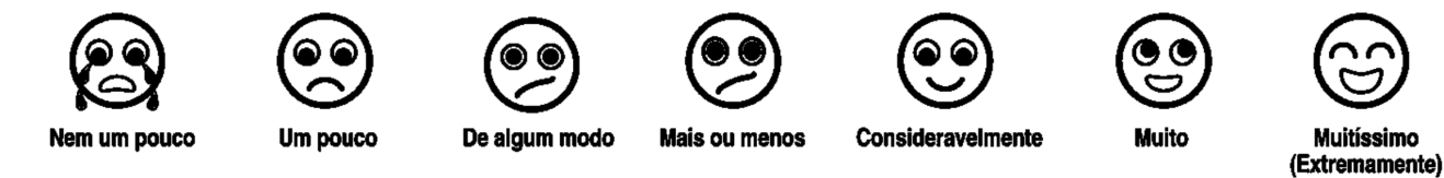
Figura 1. Escala de apoio visual adaptada à escala de respostas do SADL, para questões com pontuação não invertida