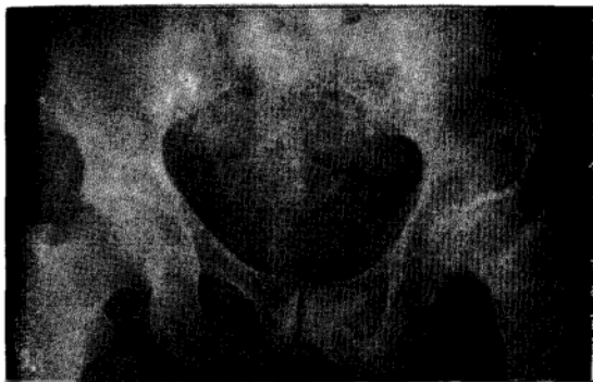
Figura 4 - Caso 5: lesão osteolítica do osso coxal e deformação da cabeça do fêmur à esquerda.