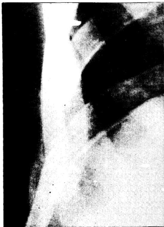
Figura 1B - Caso 2: visão focada da lesão costal, à direita.