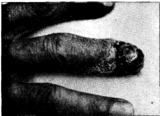
Figura 2 - Caso 3: aspecto lesional do dedo médio da mão direita.