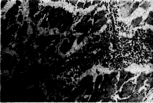
Fig. 2 — Miosite intensa com dissociação e destruição de fibras musculares em animal controle sacrificado aos 36 dias de infecção sem tratamento.