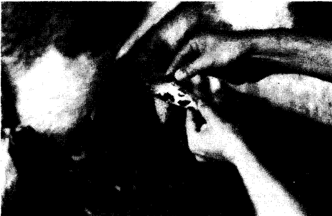
Figura 1: Lesões confluentes, em fase de crostas, na ocasião da coleta de material dos animais.

1) Isolamento e identificação do vírus : Do material de um dos animais, foi isolada uma amostra de vírus, produzindo típicas lesões de vírus vaccínico (fig. 2) nas membranas corioalantóicas (amostra n.º 1026).