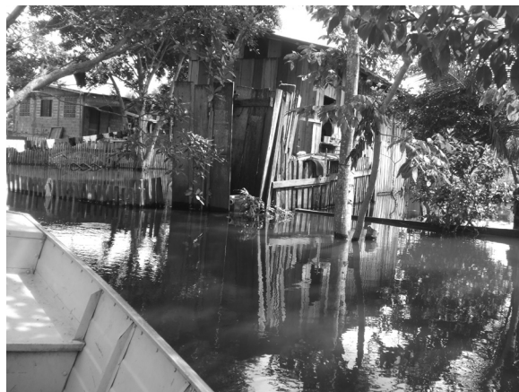
Figura 2 - Características das moradias dos ribeirinhos da Cidade de Ji-Paraná/RO

Dos sujeitos pesquisados, a maioria (15) teve suas casas alagadas nos últimos cinco anos, alguns (3) relataram que a água não chegou a casa, mas alagou toda a rua; outros (5) responderam que não tiveram problemas com o alagamento. Em caso positivo de alagamento, foram questionados sobre: Que providência tomou nessa situação?. Alguns responderam que foram para um abrigo providenciado pela Prefeitura Municipal, outros para casas de parentes ou amigos, e muitos ergueram os móveis e permaneceram na casa por medo de roubo. A maioria