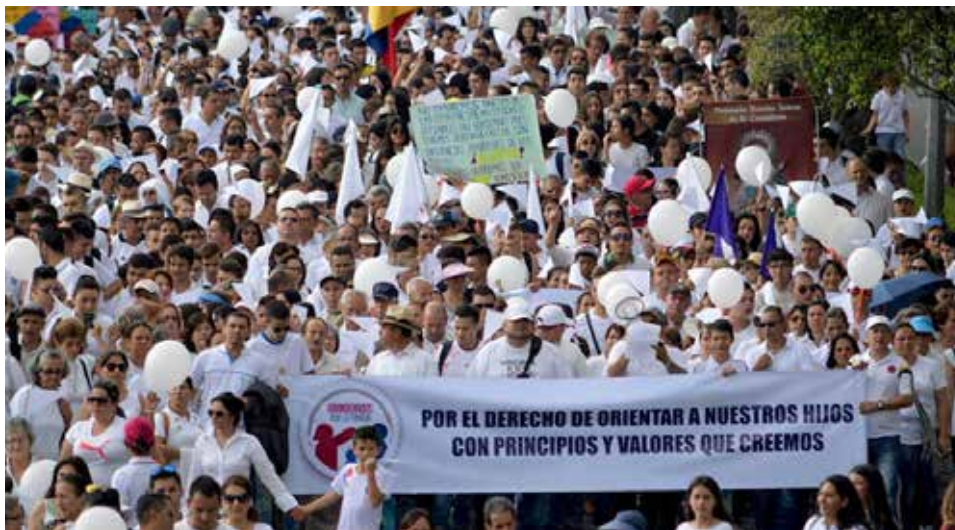
Figura 3. 5

La Conferencia Episcopal Colombiana hizo eco de estos discursos en relación con el plebiscito. En el mes de julio de 2016, poco antes de la votación, publicó un comunicado (2016d) en el que exhortaba a los ciudadanos a votar de manera informada y consciente, advirtiendo que la descomposición de la familia, el alejamiento de Dios y la “importación de modelos educativos” son, entre otras, las causas de la violencia. Alerta, asimismo, de los peligros de la ideología de género para la sociedad, llegando a afirmar que esta ideología la destruye. Un día después de las marchas convocadas, entre otros, por la Iglesia católica, en contra de las supuestas cartillas del Ministerio de Educación, esta institución celebró la masiva concurrencia a las manifestaciones.