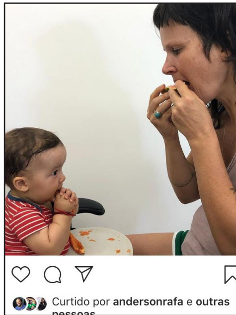
março de 2020.