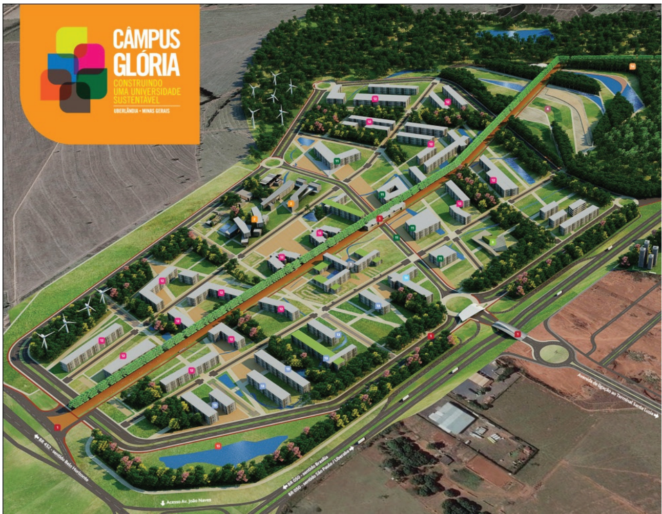
Figura 3. Mapa projetual do Câmpus Glória da UFU.

contendo o projeto urbanístico e o detalhamento das etapas de implantação até a futura consolidação como o câmpus que, a longo prazo, abrigará a maior parte das atividades da UFU.