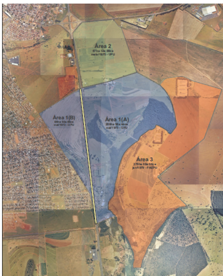
Figura 2. Mapa de divisão das glebas da Fazenda do Glória

A área 1 indicada na figura 2, localizada na porção central, foi doada pela Prefeitura Municipal de Uberlândia em 1973, justamente com o objetivo de que na área fosse implantado um câmpus único para a UFU. Essa área foi separada pela implantação da rodovia BR-050 (Uberlândia-Uberaba), sendo que do lado direito está a sede da fazenda e a área esportiva ocupada anteriormente pela ASUFUB; e do lado esquerdo, a área conhecida como “triângulo”, já inserida na malha urbana e contígua ao bairro São Jorge.