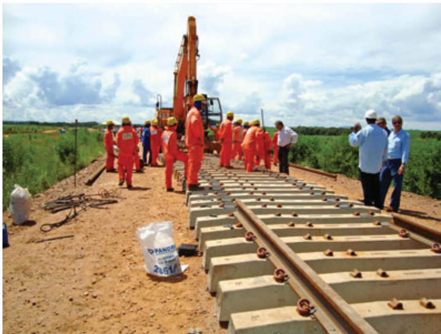
Figura 5. Obras da FNS: Uruaçu-GO