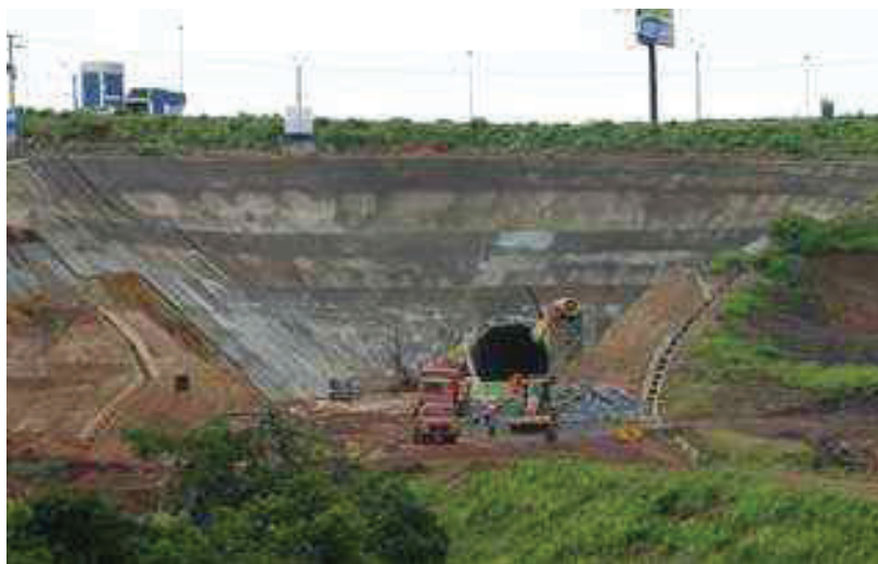
Figura 02. Marco Zero da FNS em Anápolis-GO