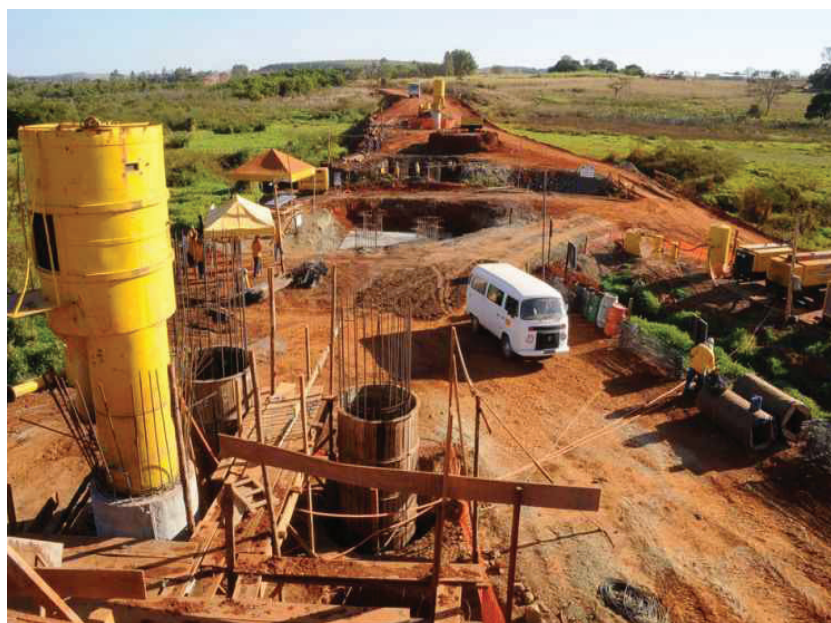
Figura 4. Canteiro de Obras: FNS-GO

Pode-se afirmar que o transporte de mercadoria através dos trilhos pode, em boa medida, colaborar para o aumento da produção econômica por onde passam, fazendo crescer as relações comerciais entre as regiões, concorrendo para o aumento das importações e exportações no mercado interno e externo. Contudo, não se pode esquecer que a FNS surgiu como um projeto de fora para dentro (e não com foco no desenvolvimento endógeno da região), ou seja, seus objetivos pioneiros coadunaram com as estratégias de desenvolvimento do sistema capitalista de produção, resultado da divisão internacional do trabalho entre países e nesses as parcelas que cabem a cada região produzir.