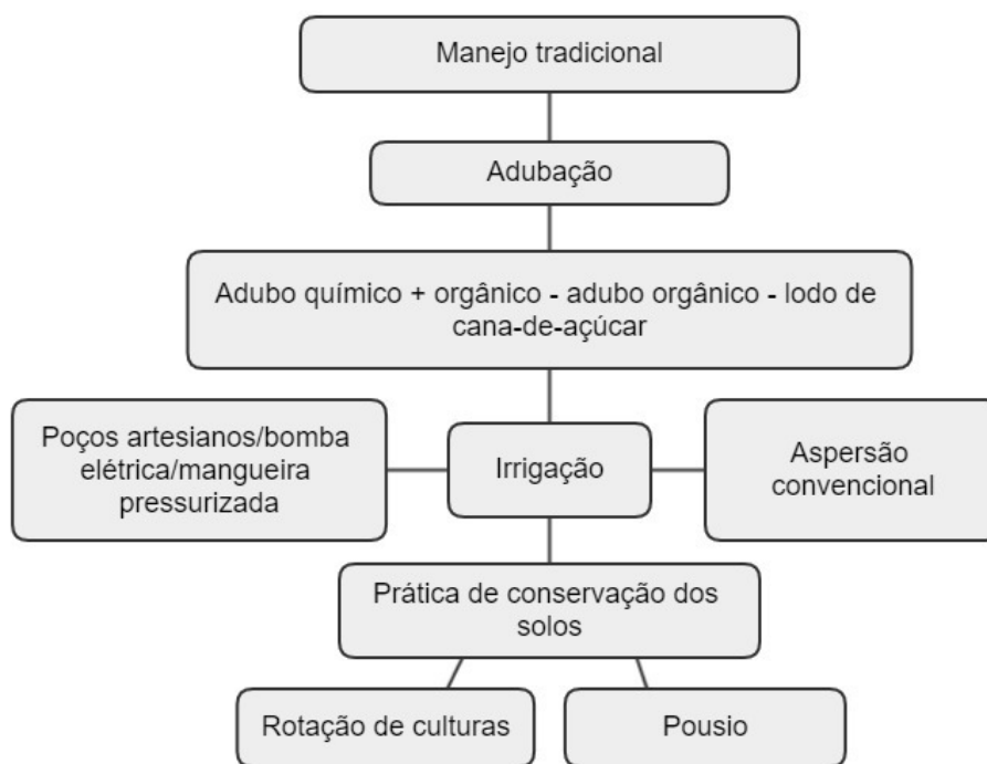
Figura 3: Etapas do manejo tradicional praticado na agricultura familiar no município de São João da Barra, norte do estado do Rio de Janeiro.

em que nenhuma lavoura é plantada no terreno. Já a rotação de culturas é a alternância de plantio de espécies diferentes em um único terreno o que garante a inserção de nutrientes variados no solo. Estas etapas possibilitam a conservação do solo por meio de observação dos seus ciclos naturais, em que a rotação de culturas insere novos nutrientes no solo à medida que há variação nas espécies cultivadas e no seu descanso total na etapa de pousio. A figura 3 demonstra os níveis em que o manejo tradicional é realizado na prática da agricultura familiar no 5º Distrito do município de São João da Barra, no norte fluminense.