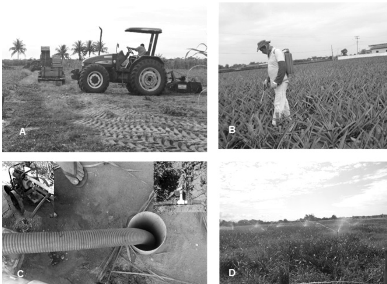
Figura 2 - Técnicas e instrumentos modernos utilizados na agricultura familiar no município de São João da Barra, norte do estado do Rio de Janeiro. A - Utilização de trator para preparação do solo; B - Aplicação de fertilizantes; C - Poço artesiano, bomba elétrica e magueira pressurizada; D - Aspersão convencional.

poços artesianos via modelo aspersão convencional (Figura 2D). Nesta técnica de irrigação são fixados sistemas de canos na área central da lavoura em que são liberados jatos de água semelhantes a gotas de chuva. Um agricultor descreveu que em lavouras de abacaxi é utilizada uma técnica de proteção da fruta em que esta é envolta em folhas de jornal para evitar queimaduras em seu estágio final de desenvolvimento devido à luminosidade solar.