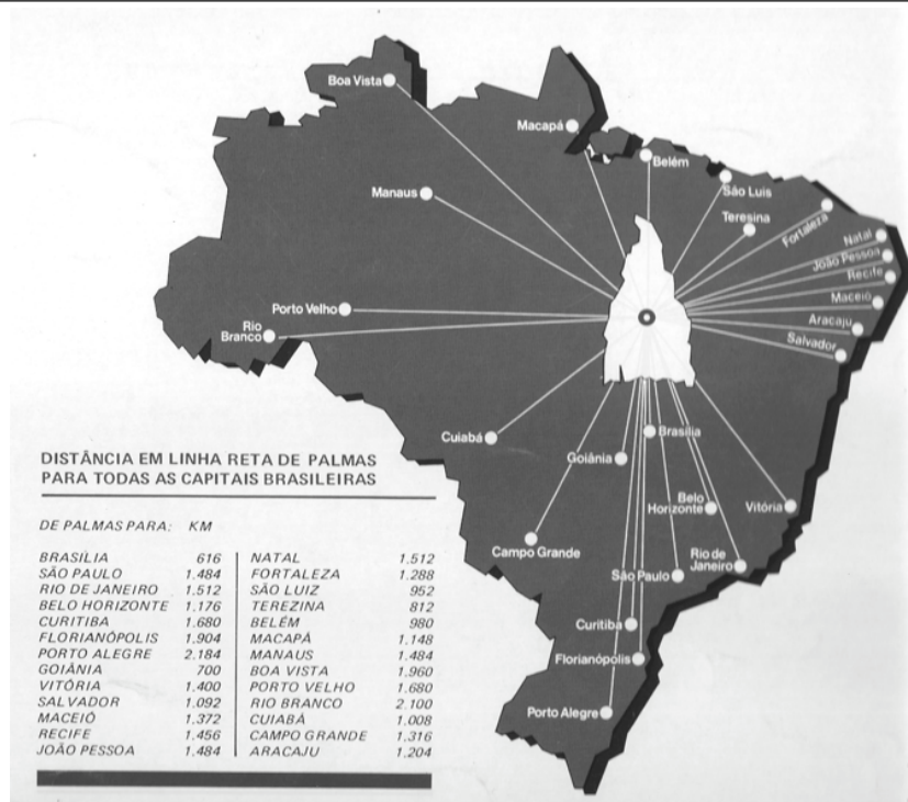
Figura 3. Distâncias em linha reta de Palmas para todas as capitais brasileiras. Fonte: Folder de Divulgação publicado pelo governo do Estado do Tocantins s/d, intitulado: Palmas A Capital do Ano 2000.