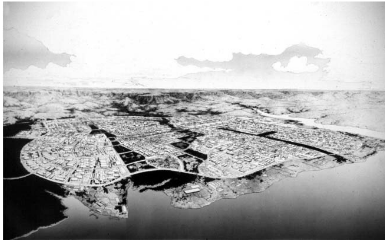
Figura 1. Perspectiva de Palmas 2020. Fonte: Arquitetos do Grupo 4 de Goiânia (org.).

exista e a imaginação trabalha futuros possíveis, em tal movimento, as soluções antecedem os problemas e as imagens apontam a atmosfera de admiráveis futuros como observamos nessa projeção da cidade de Palmas para 2020 (Fig. 1):