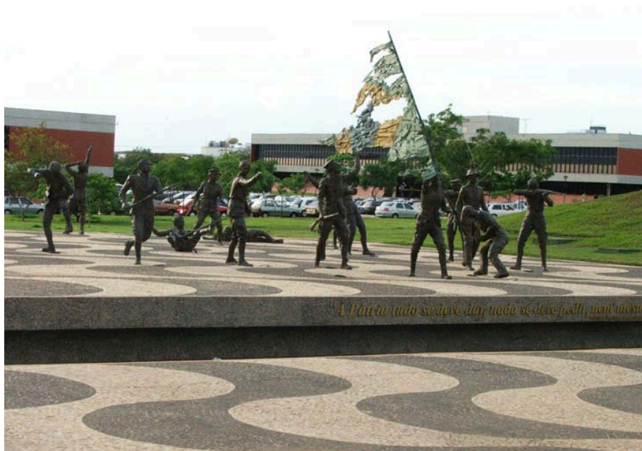
Figura 2. Monumento aos 18 do Forte, fotografia tirada agosto de 2004.

passado, como por exemplo, o monumento aos 18' do Forte de Copacabana (Fig. 2):