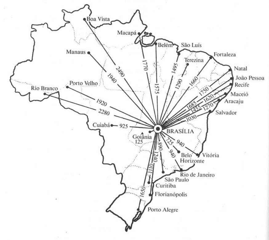
Figura 4. Distâncias entre Brasília e as capitais dos estados brasileiros. Fonte Holston, 1993, p. 26.