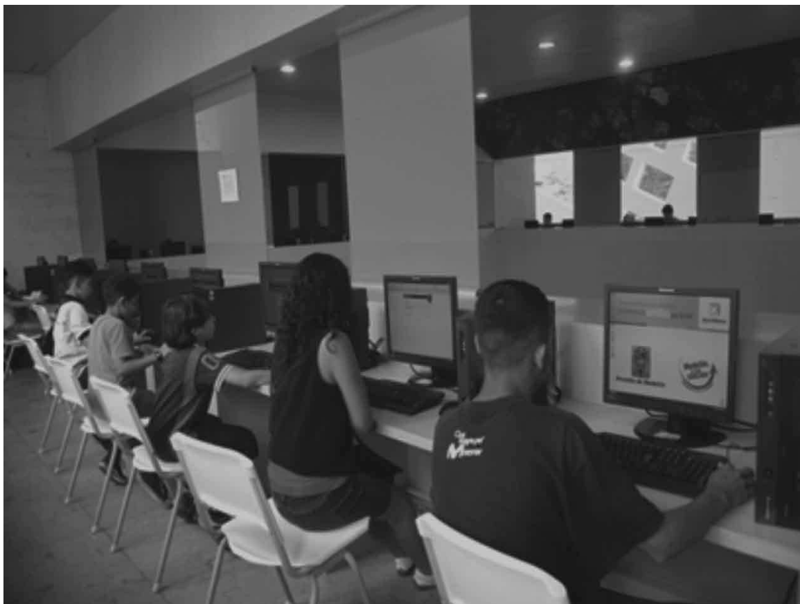
Imagem 4. Jovens e crianças usando os computadores do Parque Biblioteca España

Em termos gerais, através desse trabalho, percebeu-se como os jovens demonstram ter uma sociabilidade muito limitada e fragmentada. A incapacidade de circulação pela cidade, a “âncora de sociabilidade” a que o bairro, perversamente, submete, impossibilitando o movimento pela cidade e a ampliação de sociabilidades territorialmente demarcadas, parece ser um dos principais traços das sociabilidades jovens nesses bairros de Porto Alegre. As únicas fontes claras de criação de redes são o colégio e o bairro e, em menor medida, a família. Se admitirmos que a sociabilidade seja um princípio de abertura e de transcendência social, que permite conhecer e assimilar aquilo que é desconhecido, que não