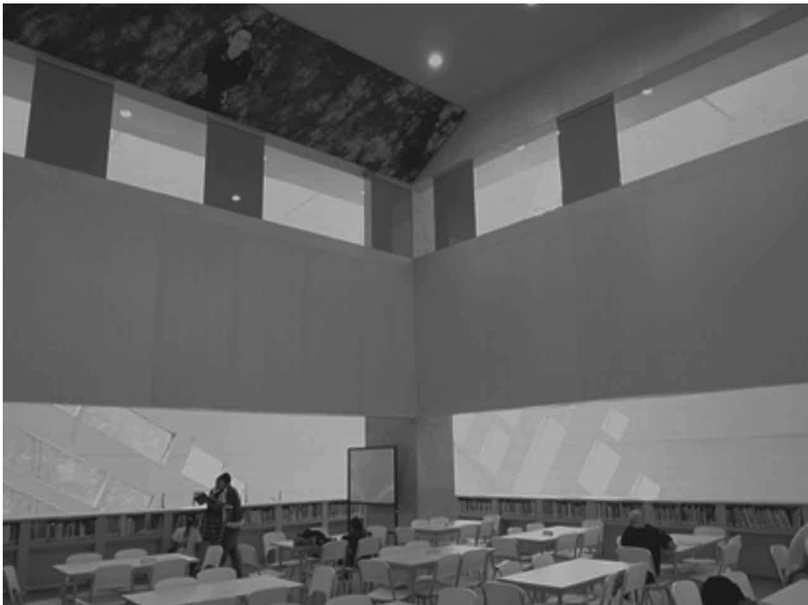
Imagem 3. Vista interior do Parque Biblioteca España

As ideias essenciais do “projeto” consistem em coparticipar da transformação da “mentalidade das comunidades” menos favorecidas, melhorar o entorno físico e cultural, servir de estímulo e motor para sua renovação e mudança, favorecer seu “orgulho cidadão” e “sentido de pertença” e, obviamente, oferecer alternativas de alta tecnologia para a diversão, a conectividade, educação e cultura. Por sua moderna estética e atração, o “Parque Biblioteca” converteu-se em referente urbano e arquitetônico, sob o lema: “o melhor para os que mais necessitam”, proporcionando ambientes interiores para o estudo e a cultura, e espaços públicos exteriores para a interação comunitária, as atividades lúdicas e o lazer.