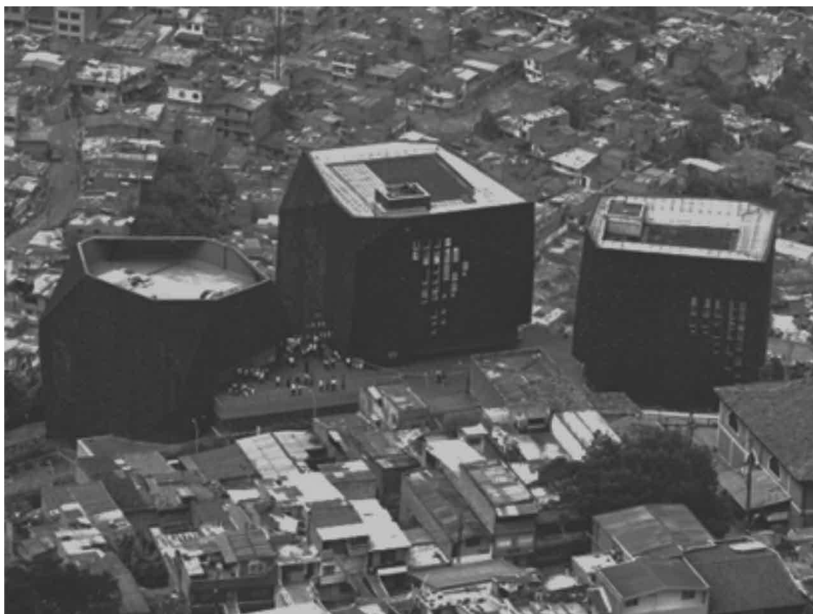
Imagem 2. Vista aérea dos três prédios que compõem o Parque Biblioteca España