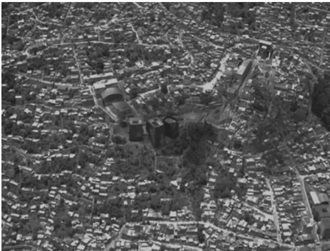
Imagem 1. Vista aérea do Parque Biblioteca España (ao centro) e do bairro

Importante esclarecer que não se tratou de uma iniciativa pensada unicamente como uma política para a juventude, nem de instituições ou organismos dedicados a esse público. Foi sim uma política mais abrangente de inibição da violência na região, mas que teve entre a população jovem o seu objeto mais atingido. O Parque Biblioteca España seria o quarto Parque dos cinco propostos pelo governo da cidade, e trouxe uma enorme expectativa nos moradores do bairro e de toda a comunidade nacional da Colômbia. Como bem mencionam Vélez e Isaza (2011), este espaço no bairro é hoje muito valorizado pela maioria dos seus habitantes