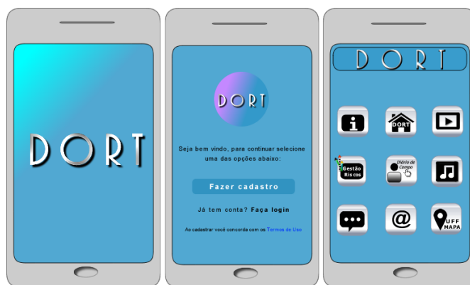
Figura 1 - Tela inicial e tela dos ícones do aplicativo DORT

O aplicativo consta de 21 telas. Na tela inicial do aplicativo DORT (Figura 1), o usuário efetua o cadastro. Logo após o login, segue a tela dos ícones correspondentes as abas, sendo necessário clicar em cada ícone para visualização do conteúdo. Na primeira aba, informações ao usuário sobre o aplicativo e documentação de ajuda, a seguir, a aba - DORT, estruturada com subgrupos de abas da seguinte forma: introdução aos conceitos fundamentais e uma visão geral da temática; enfermagem e fatores de riscos; principais distúrbios e prevenção.