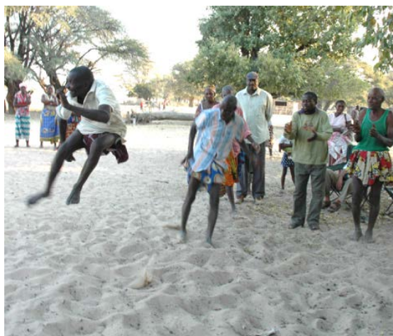
Figura 2: Pulo do engolo, Kahani Waupeta – Mucope, 2010

Nossos interlocutores usaram termos gerais como mussana (o chute), ngatussana (chutar) e koyola (arrastar ou puxar), mas não empregaram um sistema formalizado de nomes de golpes, como existe nas artes marciais codificadas. Observamos três tipos principais de ataque: chutes frontais, chutes circulares e rasteiras ou vingativas.