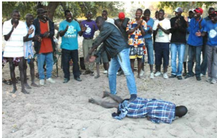
Figura 6: Engolo, pisando o adversário derrubado – Mucope, 2010