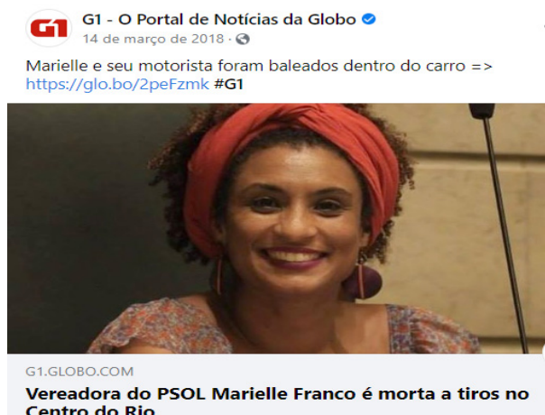
Figura 1. Postagem disparadora do G1

Três meses após o assassinato e a divulgação da matéria no Facebook, ocasião em que esta pesquisa teve início, a postagem contava com 1,6 mil comentários, 21 mil reações e 3,9 mil compartilhamentos. Em fevereiro de 2020, momento de escrita deste artigo, o mesmo post conta com 2,3 mil comentários, 20 mil reações e 3,8 mil compartilhamentos. Nota-se um aumento do número de comentários e diminuição das outras formas de interação com a postagem.