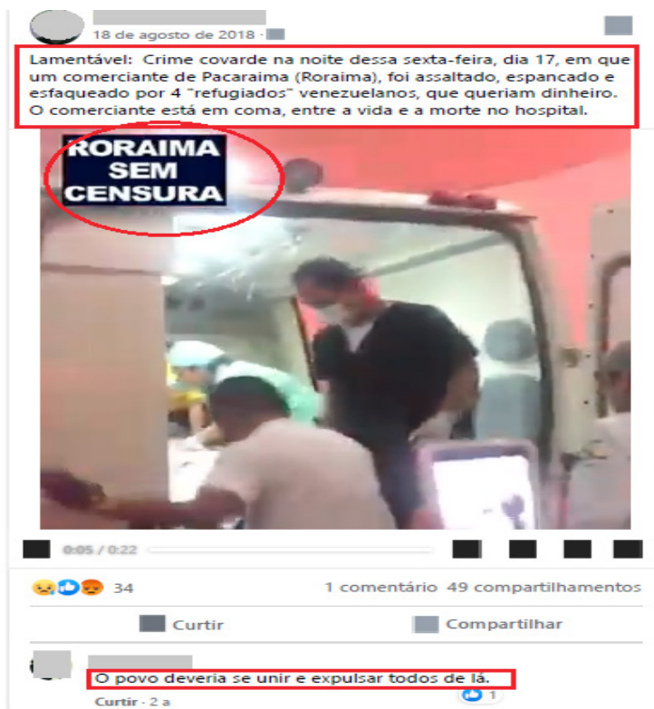
Imagem 6. Vídeo compartilhado da Página Roraima sem Censura em 18 de agosto de 2018.

Na captura de tela da imagem 6, o vídeo compartilhado da Página Roraima sem Censura é narrado por uma voz feminina que diz: “Esse aqui é nosso amigo de Pacaraima, comerciante, minha gente, que foi esfaqueado e atacado por quatro venezuelanos ”. Esse boato se espalhou rapidamente em outros grupos do Facebook, e logo os moradores de Pacaraima, revoltados com a situação, se organizaram (também por meio de sites de redes sociais e aplicativos móveis) para concretizar o ataque de 18 de agosto de 2018. Depois do episódio, descobriu-se que o assalto de fato aconteceu, mas o comerciante brasileiro não foi esfaqueado e nem assassinado, e a participação dos migrantes venezuelanos no assalto continua sob investigação.