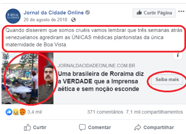
Imagem 8. Relato compartilhado na Página do Jornal da Cidade Online no Facebook em 20 de agosto de 2018.

Uma das características mais importantes das narrativas nas mídias sociais é seu potencial de circularem para além do contexto em que foram originalmente publicadas e de serem exponencialmente compartilhadas, tornando-se em pouco tempo virais (DE FINA & GORE, 2017). Essa quantidade de compartilhamento, segundo De Fina & Gore (2017), multiplica não apenas o número de leitores da narrativa original, mas também a capacidade dos usuários de moldar a história. As imagens 8 e 9 exemplificam a mobilidade que caracteriza as narrativas na internet.