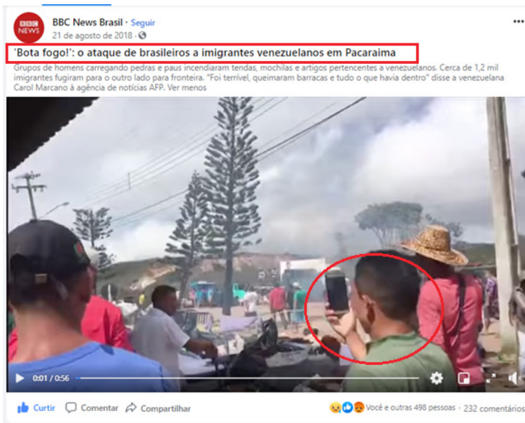
Imagem 1. “Bota Fogo!”. Vídeo compartilhado em 21 de agosto de 2018 12 .

Na imagem 1, apresento a captura de tela de uma notícia com vídeo compartilhada na Página do Facebook da BBC News Brasil em 21 de agosto de 2018. O título da notícia Bota fogo!: o ataque de brasileiros a imigrantes venezuelanos em Pacaraima , um trecho do lide “Grupo de homens carregando pedras e paus incendiaram tendas, mochilas e artigos pertencentes a venezuelanos (...)” e a fumaça escura ao fundo da imagem registram como o ataque aconteceu. Na imagem também se vê um morador registrando o evento com seu celular. Ao assistir ao vídeo, é possível escutar barulhos de bombas, tiros e a voz de alguns participantes do ataque, dizendo: “Bota fogo!”, “Vamos botar fogo, gente!”, “Aqui tem fogo!”, “Esses vagabundos!”.