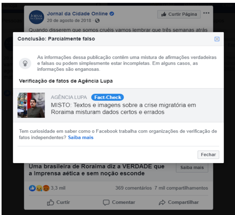
Imagem 11. Uso da ferramenta Fact-Check na Página do Jornal da Cidade no Facebook (Acesso em: 06 jan. 2020).

Até pouco tempo o usuário do Facebook podia acessar e compartilhar o relato da moradora de Roraima e chegar ao site do Jornal da Cidade Online sem “obstáculos”. Agora, como se observa na imagem 11, quando o Facebook recebe uma denúncia de seus usuários sobre o compartilhamento de alguma fake news , a plataforma solicita a verificação do post às agências parceiras. Caso o conteúdo falso seja confirmado e alguém tente compartilhá-lo, o site da rede social emite um alerta de verificação, “com um link de um post da agência de checagem comprovando a falsidade” (SCOFIELD JR., 2019, p. 65). Embora o compartilhamento da notícia com dados falsos não seja proibido, postagens como a do Jornal da Cidade Online (imagem 11) são sinalizadas e isso pode levar a uma menor circulação do post nos sites de redes sociais.