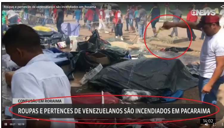
Imagem 2. Vídeo do ataque postado em 18 de agosto de 2018 13 .

O que se vê na imagem 2 e no título é uma cena das “roupas e pertences de venezuelanos [sendo] incendiados em Pacaraima”. A reportagem informou que todo o ato foi organizado pelas redes sociais e também divulgou fotos de uma barricada de pneus com fogo usada para fechar a fronteira. Ao longo do vídeo, há diferentes vozes de brasileiros narrando a participação no conflito, segue a transcrição de uma delas: “O pau tá comendo, menino, tamo expulsando os venezuelanos! É desse jeito agora. Se não tem governante, se não tem autoridade por nós, nós vamos fazer a nossa autoridade. Fora, venezuelanos, de dentro de Pacaraima! É assim que funciona a partir de agora!” (Voz masculina).