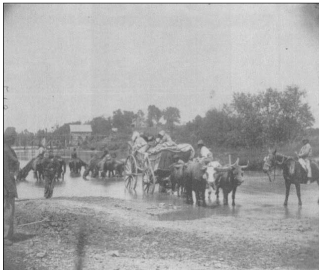
Foto 1 – Contrabandos chegando às linhas da União.