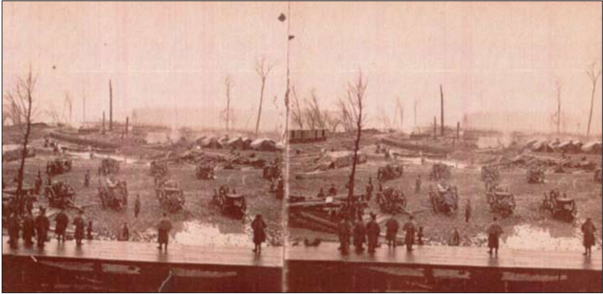
Foto 5 – Soldados Negros no Tennessee.