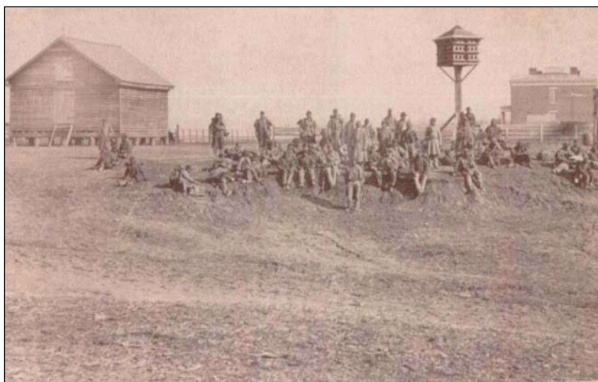
Foto 4 – Soldados Negros no front .