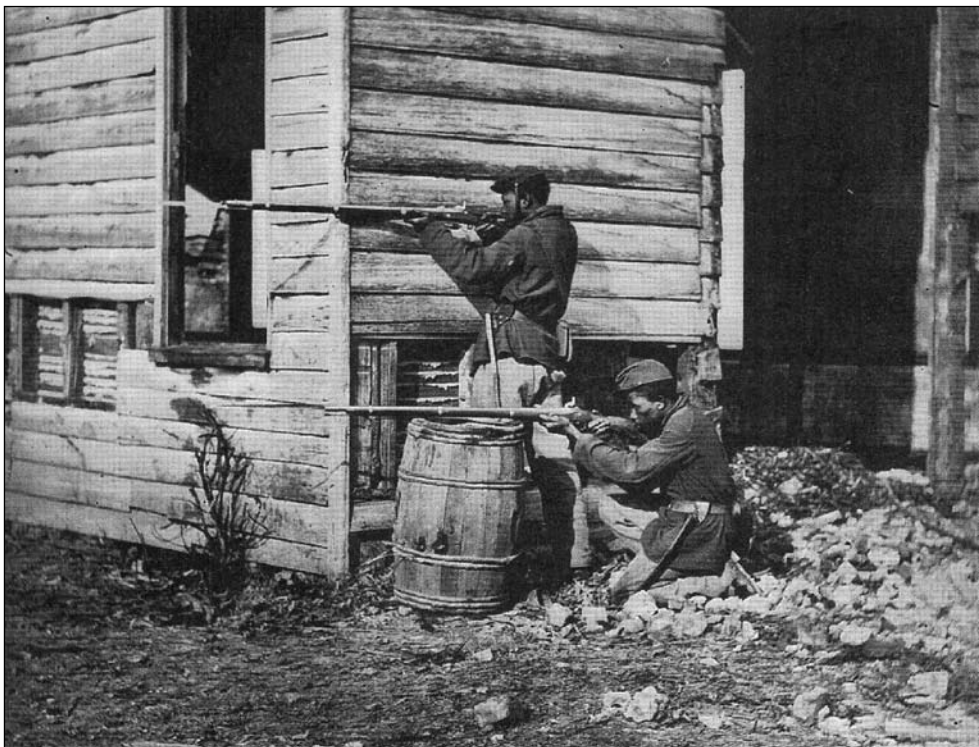
Foto 3 – Soldados Negros na Virginia. Em Forged in Battle , de Joseph T. Glatthaar.