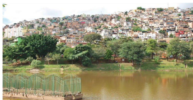
Panorâmica do Morro do Papagaio - Barragem Santa Lúcia Foto: Júlio Fessô - Julho de 2021