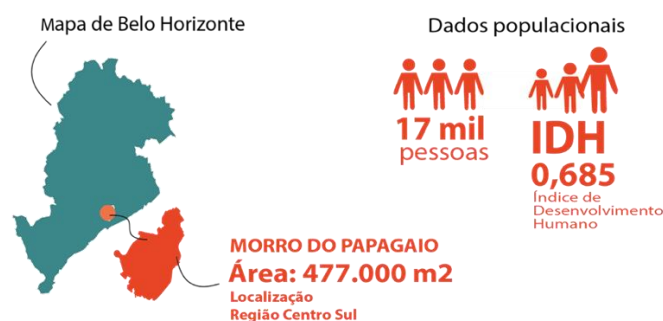
Figura 1 - Dados do Morro do Papagaio