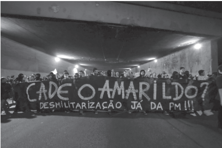
Imagem 3: “Cadê o Amarello?”, ago. 2013. Disponível em: http://www.rededemocratica.org/images/2013/08/protesto-amarildo-desmilitarizacao-pm.jpeg ; Acesso em: 07 set. 2013.