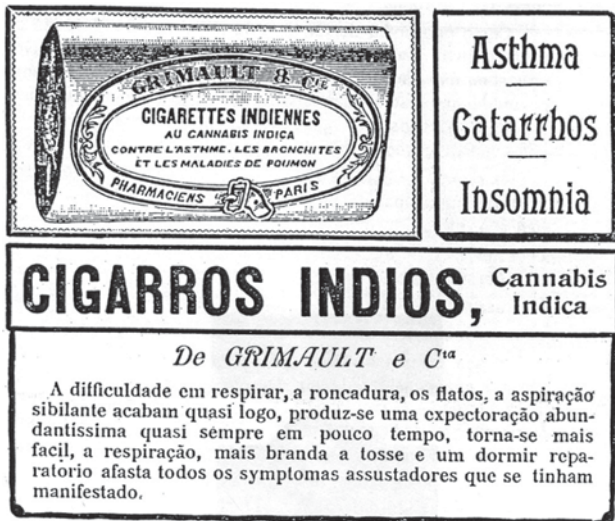
Figura 2. Propaganda dos cigarros Grimault

Foi também na década de 1930 que a repressão ao uso da maconha ganhou força no Brasil. Possivelmente essa intensificação das medidas policiais surgiu, pelo menos em parte, devido à postura do delegado brasileiro na II Conferência Internacional do Ópio, realizada em 1924, em Genebra, pela antiga Liga das Nações. Constava da agenda dessa conferência discussão apenas sobre o ópio e a coca. E, obviamente, os delegados dos mais de 40 países participantes não estavam preparados para discutir a maconha. No entanto o nosso representante esforçou-se, junto com o delegado egípcio, para incluí-la também: