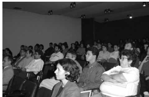
Vista parcial dos presentes