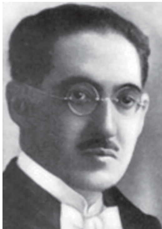
Fig. 1. Oscar Freire.

A Entomologia Forense no Brasil. No Brasil, o marco inicial da entomologia forense está associado ao trabalho de Oscar Freire (Fig. 1); em 1908, apenas quatorze anos após a publicação do trabalho de Mégnin (1894), apresentou à Sociedade Médica da Bahia a primeira coleção de insetos necrófagos e os resultados de suas investigações, em grande parte obtidas em estudos com cadáveres humanos e de pequenos animais.