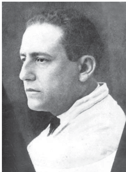
Fig. 2. Edgard Roquette-Pinto.

Esse primeiro período se encerra com a magnífica obra de Pessôa & Lane (1941) sobre os coleópteros de interesse médico-legal do Estado de São Paulo. Os autores trataram especialmente da família Scarabaeidae, mas também apresentaram nesse artigo um histórico detalhado das pesquisas sobre o tema, no Brasil e no mundo, até aquela data. Importantes dados sobre a taxonomia e biologia dos besouros necrófagos foram fornecidos.