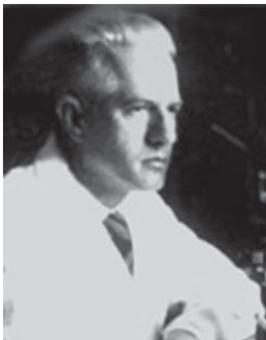
Fig. 4. Samuel Pessoa.

Mais de 20 pesquisadores em entomologia forense ligados a Instituições de Ensino Superior atuam hoje em dia em todas as regiões brasileiras (Fig. 6). Destacam-se ainda a formação e qualificação de dezenas de peritos e médicos-legistas de todas as regiões brasileiras em três Cursos Especiais de Entomologia Forense, promovidos pela ação conjunta do Ministério da Justiça, do Ministério da Ciência e Tecnologia e da Universidade de Brasília, onde foi desenvolvido o projeto do Centro Nacional de Entomologia Forense (2003–2005). Os Cursos foram ministrados por professores e especialistas da Universidade de Brasília, do Instituto de Criminalística da Polícia Civil do Distrito Federal, do Instituto Médico-Legal da