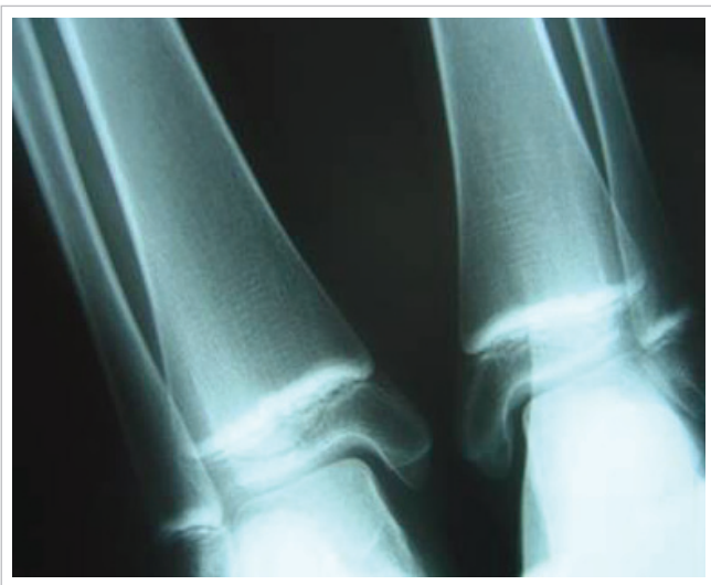
Figura 2 Linhas escleróticas em metáfises de tíbias e fíbulas distais.

5,6 anos (média de 1,6 anos). O tempo de uso do alendronato variou de 0,8 a 3,0 anos (média de 1,4 anos).