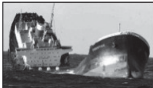
Figura 2: Afundamento do navio Prestige, em 19 de novembro de 2002

Dentre os vários julgados que ilustram a referida mudança de paradigmas, destacam-se os seguintes: