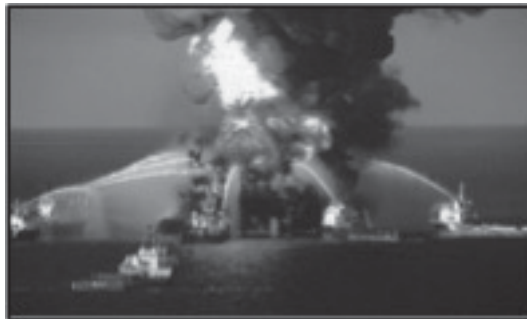
Figura 1: Explosão da plataforma Deepwater Horizon

A recente trajetória dos desastres ecológicos envolvendo a atividade petrolífera aproxima-se da formatação de um novo modelo jurisprudencial no Brasil, qual seja: o reconhecimento das práticas preventivas e precaucionais no trato dos problemas ambientais, além da inversão do ônus da prova em matéria difusa e a instrumentalidade das ações coletivas como ferramentas decisivas no controle das políticas públicas e sua repercussão nos direitos difusos.